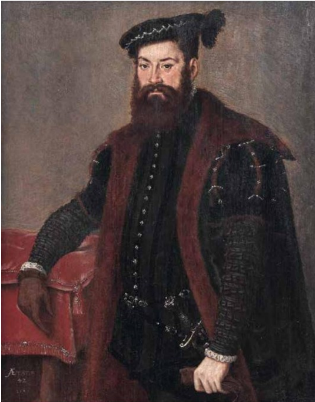
ATTRIBUÉ À HANS EWORTH (1520-1573) : Portrait présumé d'Edward Seymour.