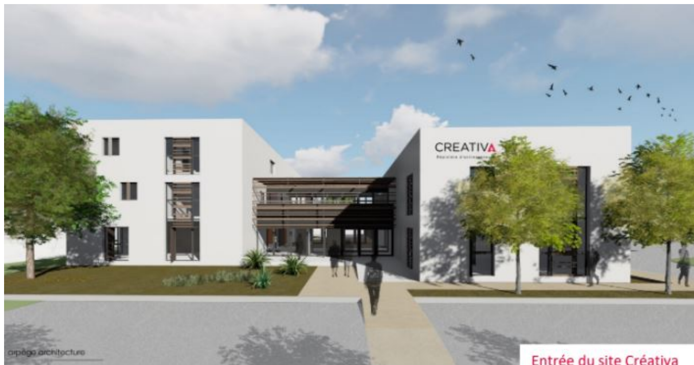
Entrée du site Créativa

D'un montant de 4,2M€, le chantier d'extension de la pépinière d'entreprises Créativa avance à grands pas, ou plutôt à grands coups de pioches.