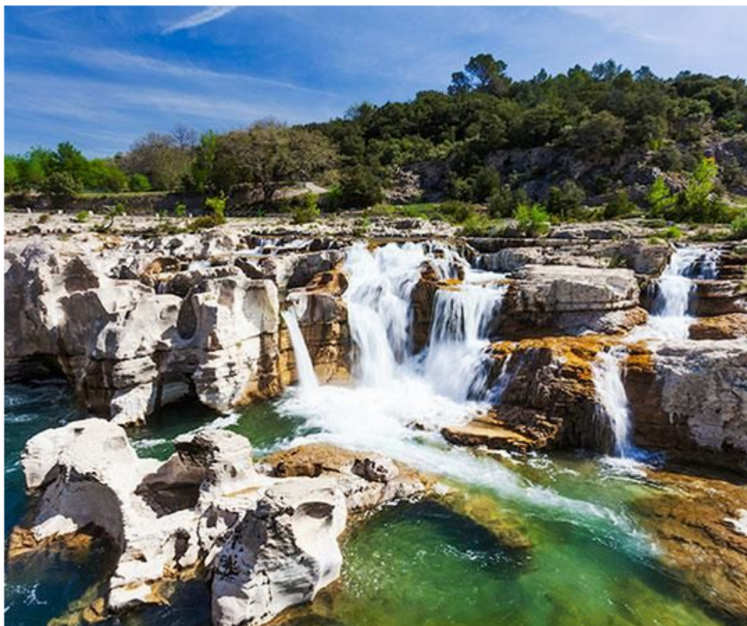
Vallée de la Cèze