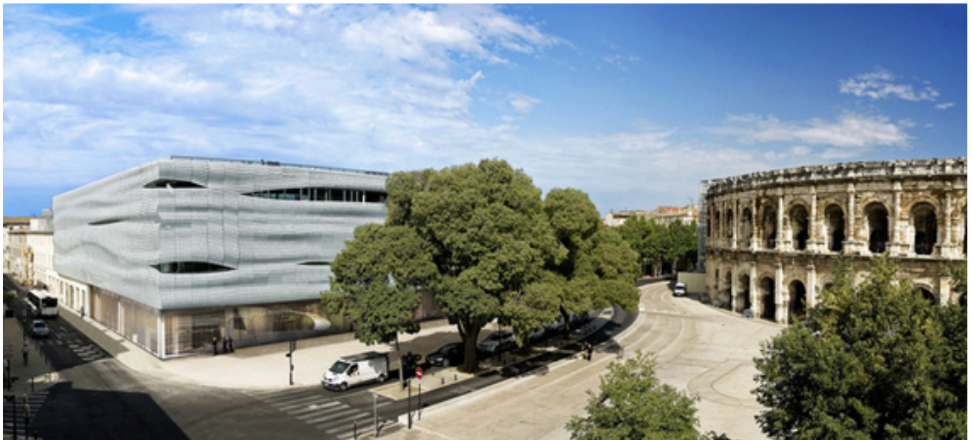
Musée de la Romanité

Mais le Gard est aussi l'héritier d'un patrimoine hors du commun avec plus de 500 Monuments historiques classés, dont le Pont du Gard et l'abbatiale de Saint-Gilles inscrits au patrimoine mondial de l'Unesco. C'est un territoire rempli de villes et villages de caractère qui ne laisseront personne indifférent tant l'atmosphère et l'architecture y sont uniques. On pense bien évidemment à Nîmes, Uzès ou encore Beaucaire mais le département regorge de pépites qui ne demandent qu'à être découvertes !