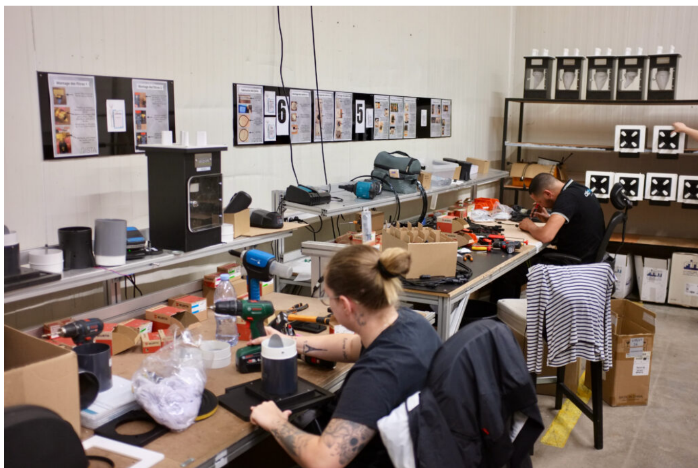
l'atelier d'assemblage