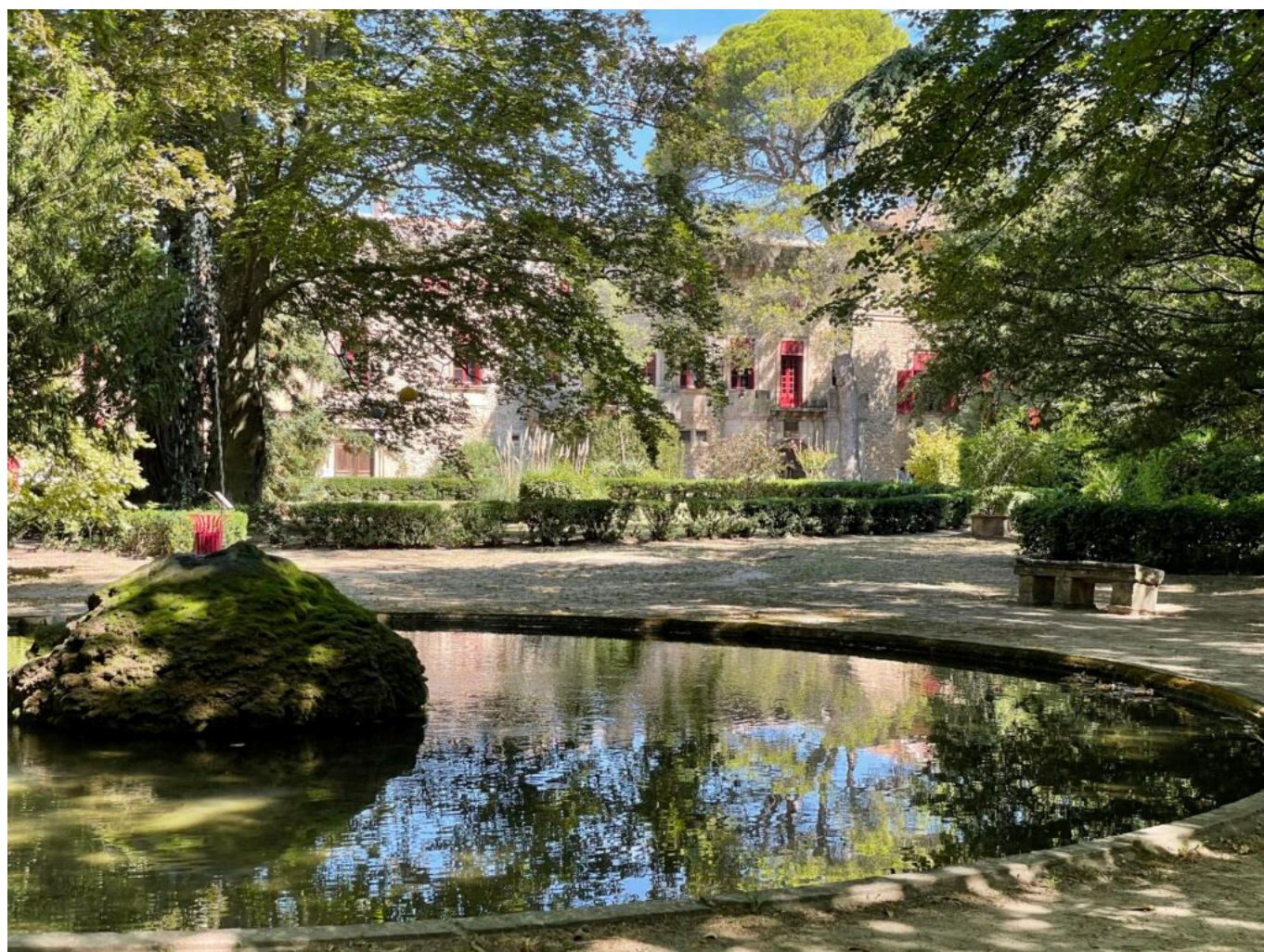
Vue du parc vers le Château

Le Château de Thézan vous attend pour un voyage au cœur de l'histoire et de la beauté. Participez à cette renaissance et découvrez les mystères que recèle ce monument exceptionnel. Ensemble, faisons briller à nouveau le 'Diamant de Provence'.