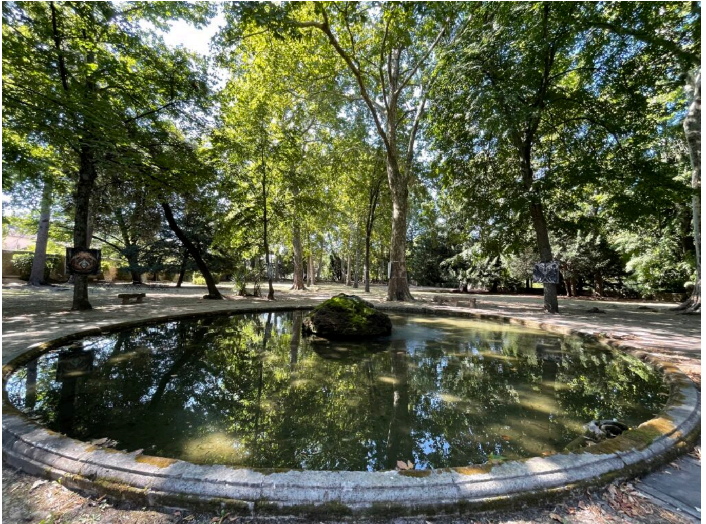
L'une des deux fontaines rocaille du Parc et ses arbres remarquables