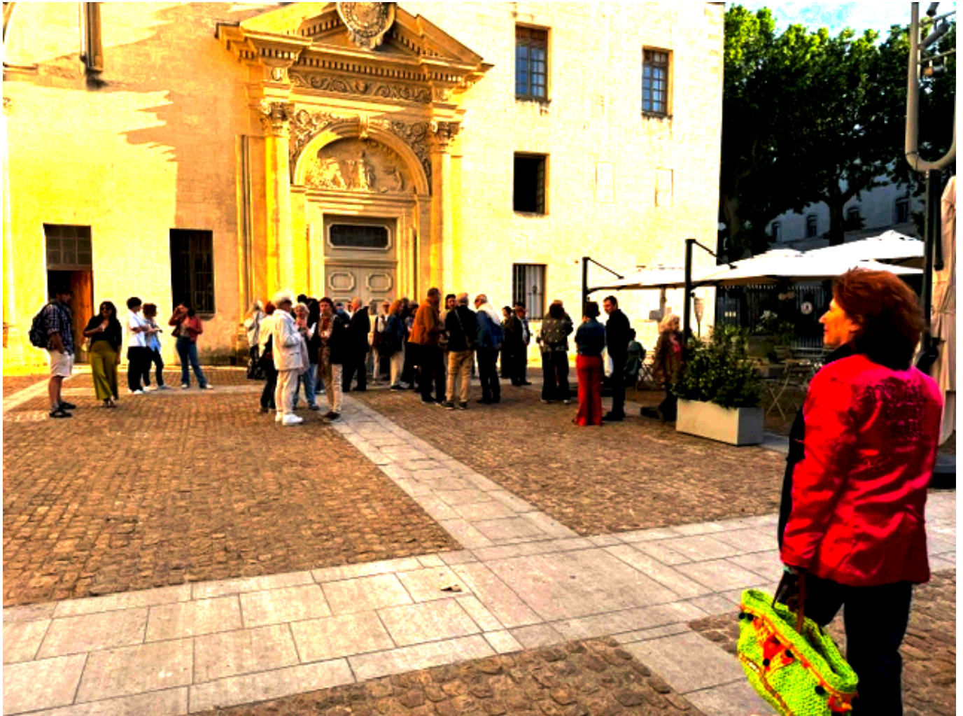
L'église des Célestins, lieu de l'exposition