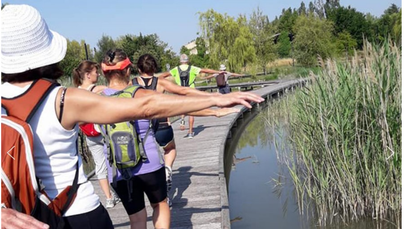
Sport avec l'Asl du lac de Montoux