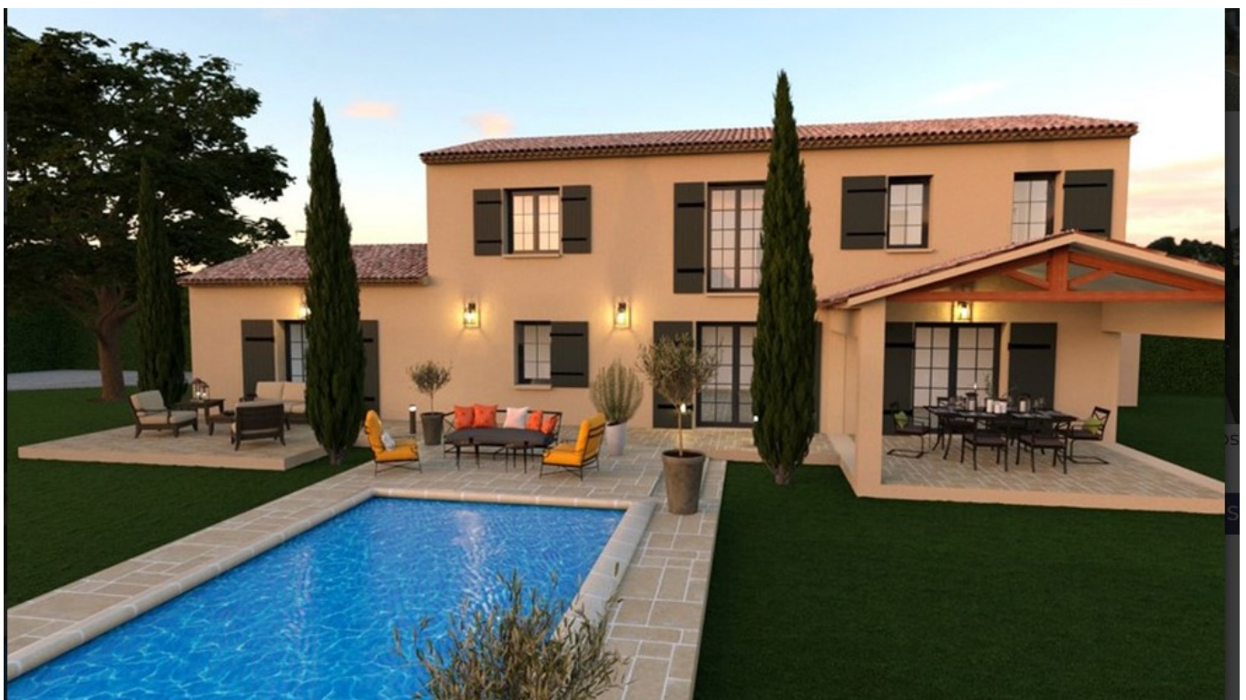
Un des modèles proposés par Groupement d'artisans

Ils ont envie d'évoluer, de se marier, d'avoir des enfants, de devenir propriétaires et de créer un foyer pour leur famille. C'est ce que nous ont inculqué nos parents : construire un patrimoine avec, en premier lieu, un toit au-dessus de soi. Aujourd'hui, l'absence de politique de logement du gouvernement prive les Français de leurs projets et de leurs rêves. »