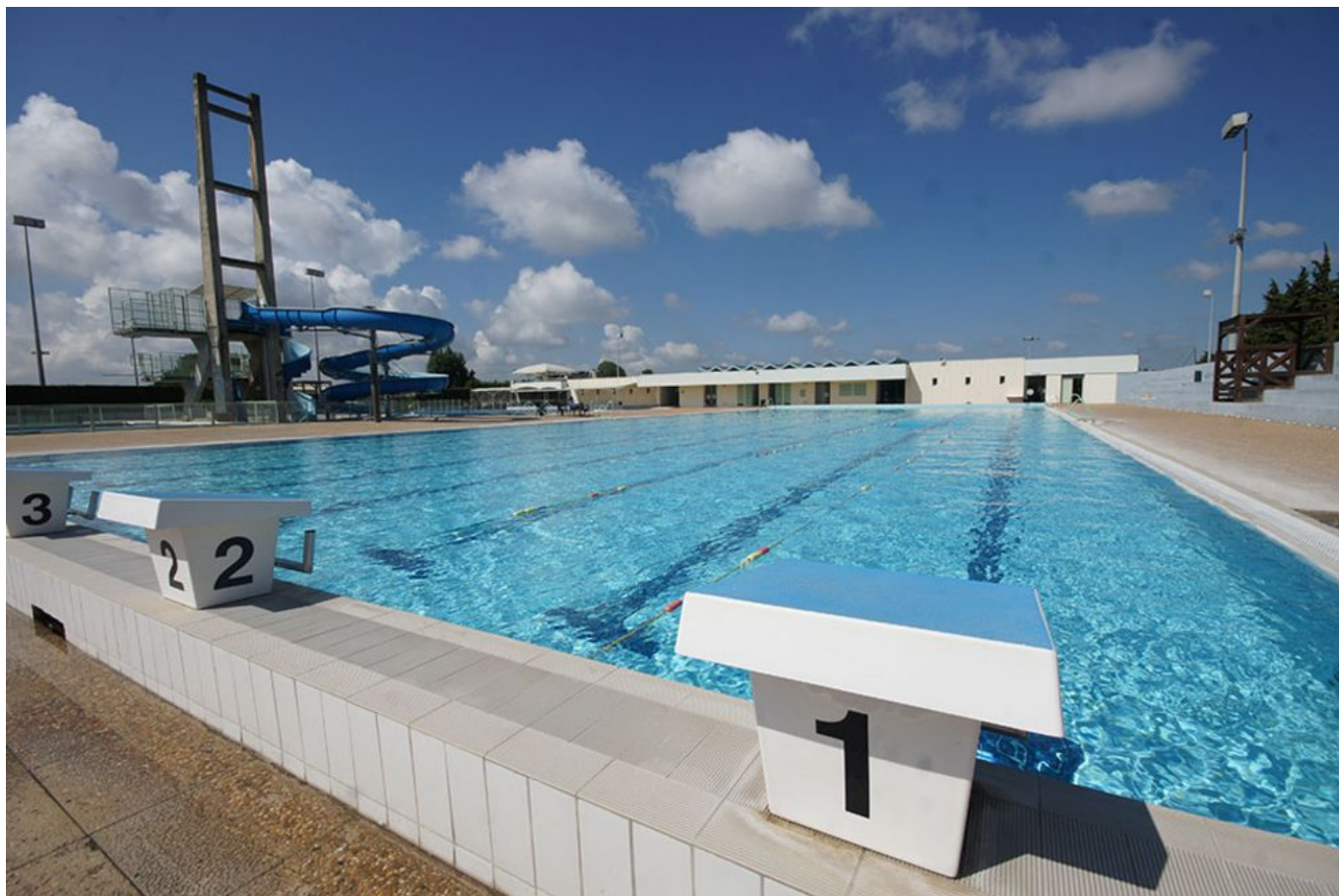
Photo: stade nautique de Carpentras

Adultes (16 ans et plus) Ticket d'entrée 2,90 €. Carnet de 10 entrées 23,00 €. Abonnement mensuel (1 photo obligatoire) 32,00 €. Ticket tarif réduit (personne handicapée) 2,30 €. Plus d'informations, cliquez ici . Téléphone : 04 90 60 80 00.