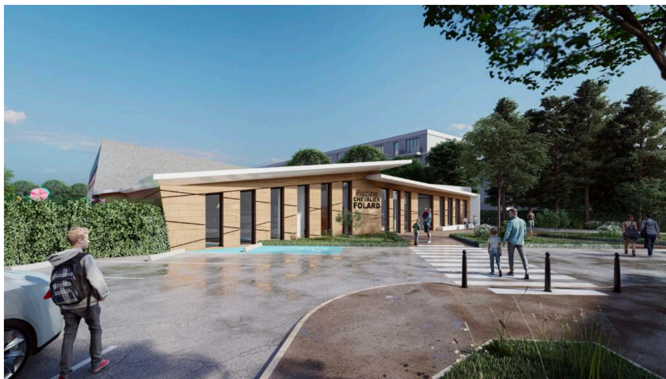
Futur extérieur de la piscine Chevalier de Folard

Dans les faits ? L'opération avoisinera les 19M€ dont un peu plus de 10M€ dévolus à conception-rénovation-réalisation et plus de 8M€ à l'exploitation et la maintenance. Tout commencera en décembre 2021 où chaque piscine entamera 12 mois de travaux, les unes après les autres afin de ne pas immobiliser toutes les activités nautiques « qui s'étendent des bébés nageurs à l'aquagym pour séniors » précise Cécile Helle. Pour les piscines Jean Clément situées 305, chemin de la Martelle, quartier de Montfavet et Stuart Mill, chemin de Malpeigné, les travaux se feront de décembre 2021 à décembre 2022. Pour Chevalier Folard, érigée dans l'avenue éponyme, les travaux s'effectueront de décembre 2022 à décembre 2023 et pour Pierre Reyne, rue Velouterie, dans l'intramuros, de décembre 2023 à décembre 2024.