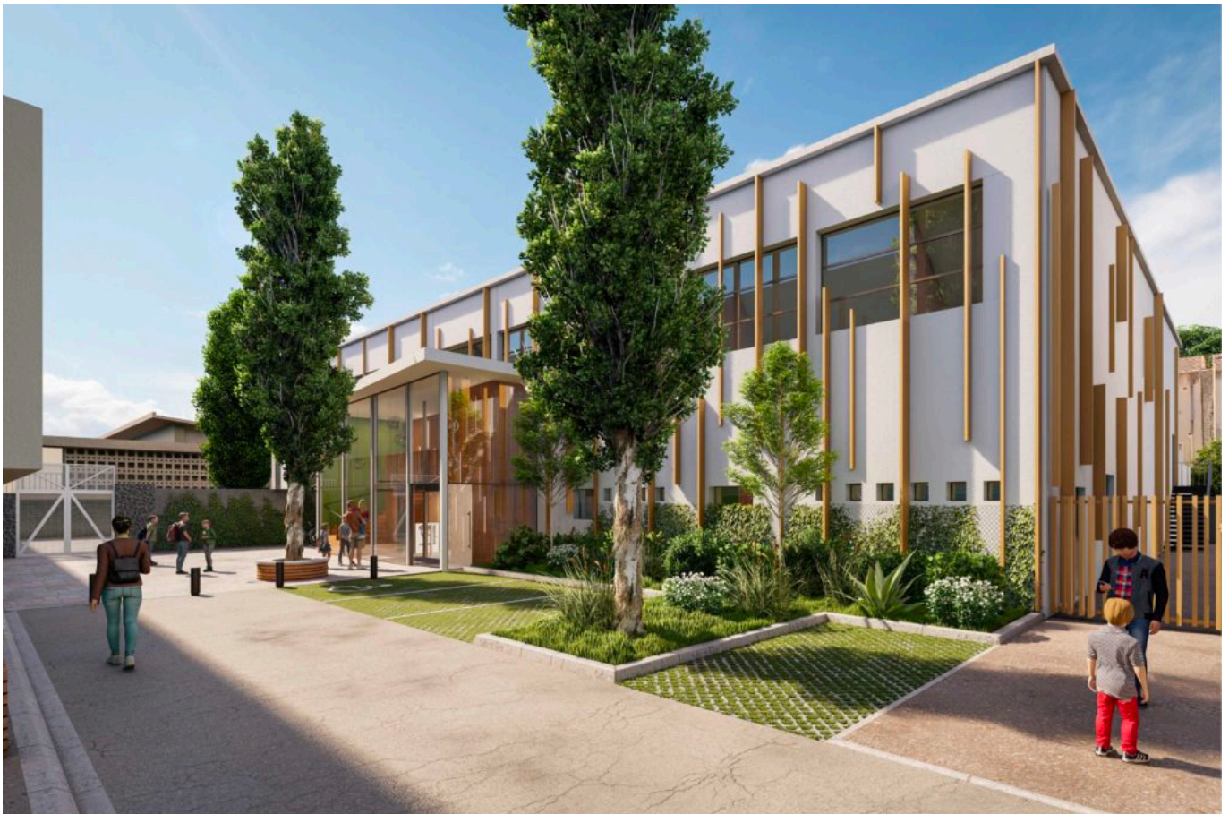
Futur extérieur de la piscine Pierre Reyne à Montfavet