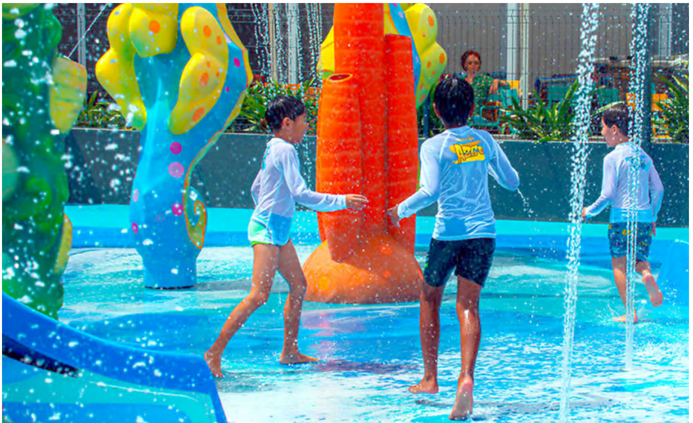
Exemple de Splachpad, jeux d'eau très sécurisés de faible profondeur