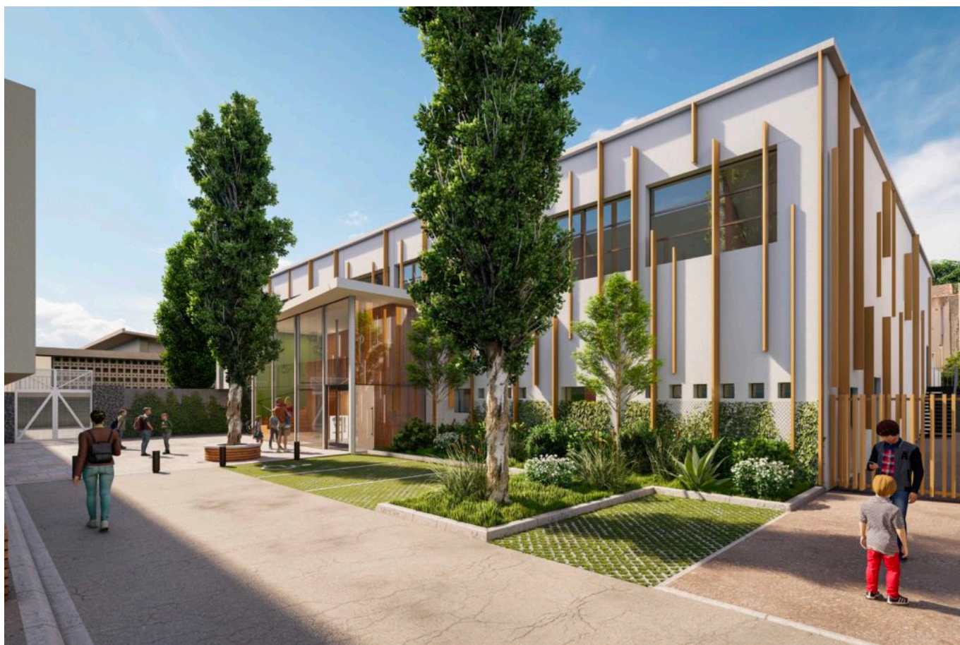
Futur extérieur de la piscine Pierre Reyne à Montfavet

Alors pourquoi conserver ces piscines de quartiers qui, dans le budget communal constituent toujours un coût et jamais de retour sur investissement ? «Bien souvent ce type d'aménagement fait partie des sacrifiés car ils coûtent, opine Cécile Helle, maire d'Avignon. Nous, nous avons choisi de les pérenniser car ils font partie de l'attractivité des quartiers et constituent un élément fort de rénovation de ceux-ci puisque ce sont des lieux de partage, d'animation et de lien social.»