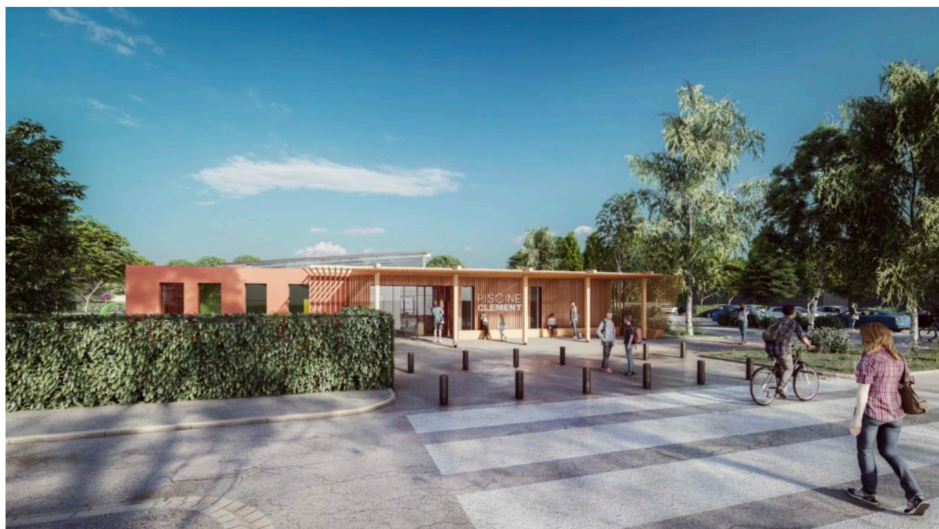
Futur extérieur de la piscine Jean Clément

«La plupart du temps vous voyez ces piscines, comme ça a été le cas pour le stade nautique, fermées, oubliées, laissées à l'abandon alors qu'elles sont des enjeux du territoire, reprend le maire. Et puis avec les températures auxquelles nous sommes confrontés en saison estivale, qui ne rêve pas de fréquenter ces lieux où l'on peut se rafraîchir et se reposer en famille, grands-parents, parents, enfants, petits-enfants, ensemble, parfois même en profitant d'un extérieur. C'est ce à quoi j'ai assisté, cet été, en me rendant au stade nautique où l'ambiance était paisible.» Justement c'est le point noir des piscines où les ados turbulents sont montrés du doigt, évinçant la tranquillité des familles et des plus petits ? « Pas quand on a mis en place des animations et cela a fait tout la différence,» souligne le premier magistrat de la ville. En termes de chiffre de fréquentation ? Le stade nautique devrait accueillir, dans une année normale, 200 000 personnes. Les autres piscines ? Peut-être tout autant...» considère l'édile.