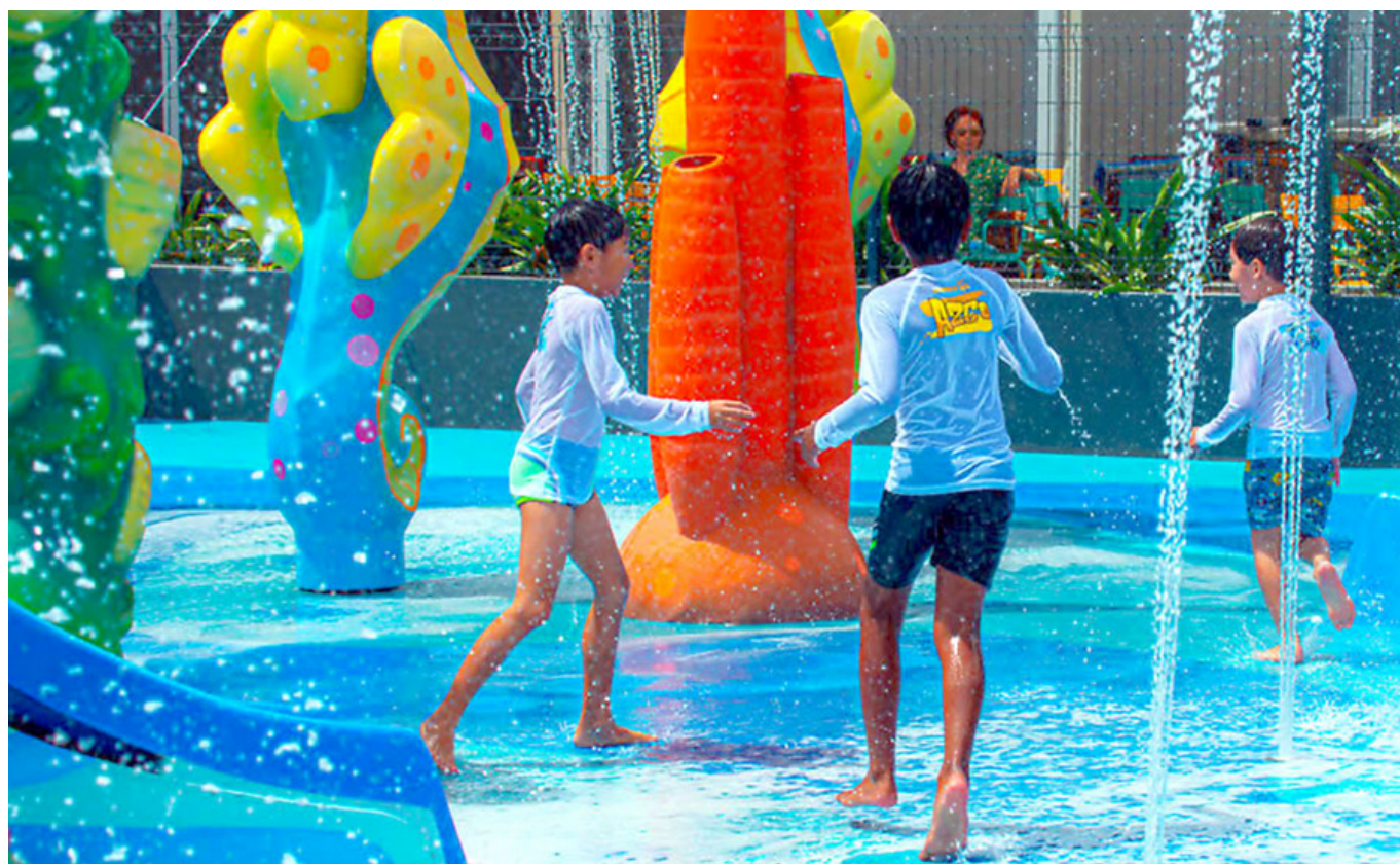
Exemple de Splachpad, jeux d'eau très sécurisés de faible profondeur