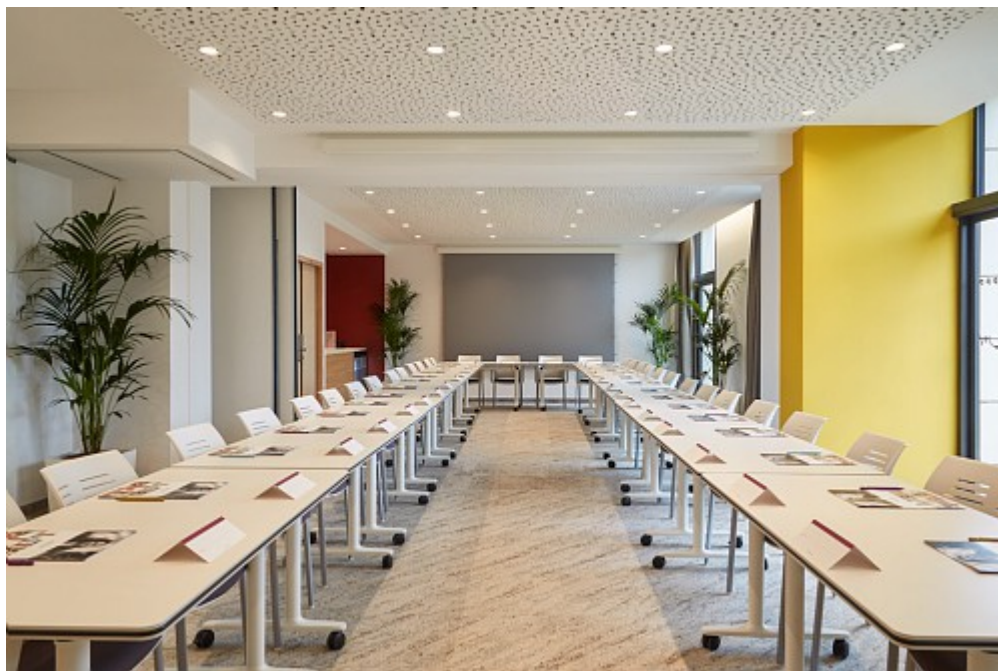
Les salles de séminaires sont High tech

Mercure Hôtels Avignon TGV. 2, rue Mère Teresa, Confluence, à Avignon. 04 32 76 88 00. Courriel HB6F6@accor.com