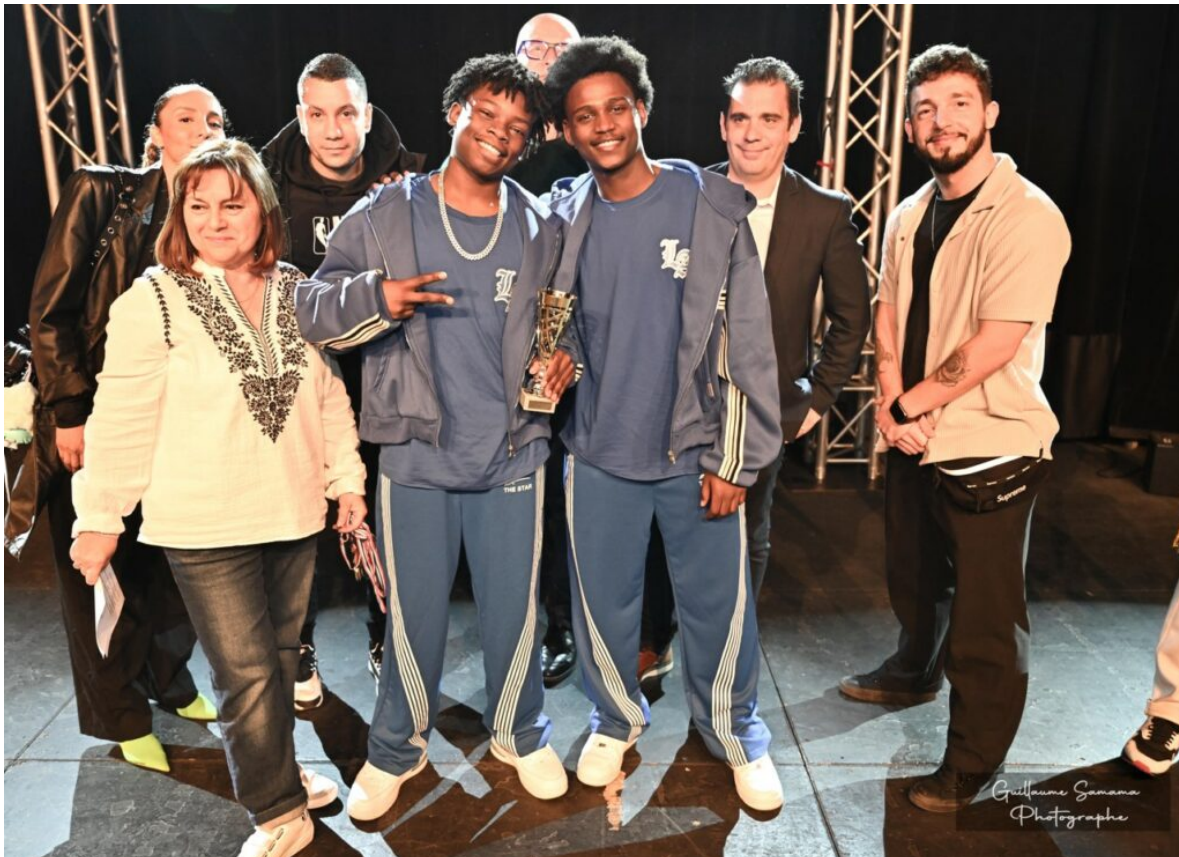
Les Two Black Brothers de l'école LNB de Bagnols-sur-Cèze .

directrice artistique de l'association organisatrice Planète bleue . L'organisation, le jury ainsi que les partenaires de la ville de Vaison-la-Romaine ont constaté que cette édition 2025 présentait un cru exceptionnel dans toutes les catégories avec « des performances proches des professionnels » selon les mots de la directrice artistique.