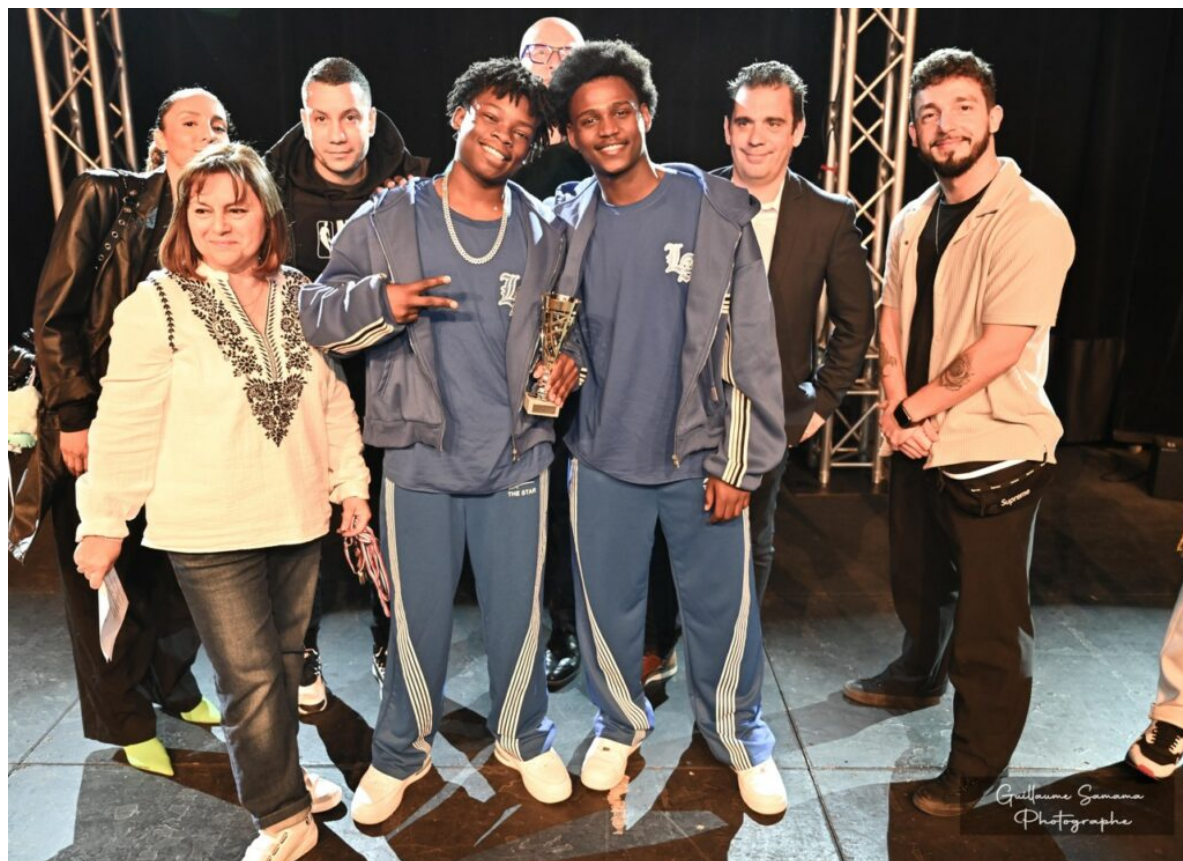
Les Two Black Brothers de l'école LNB de Bagnols-sur-Cèze .

directrice artistique de l'association organisatrice Planète bleue . L'organisation, le jury ainsi que les partenaires de la ville de Vaison-la-Romaine ont constaté que cette édition 2025 présentait un cru exceptionnel dans toutes les catégories avec « des performances proches des professionnels » selon les mots de la directrice artistique.