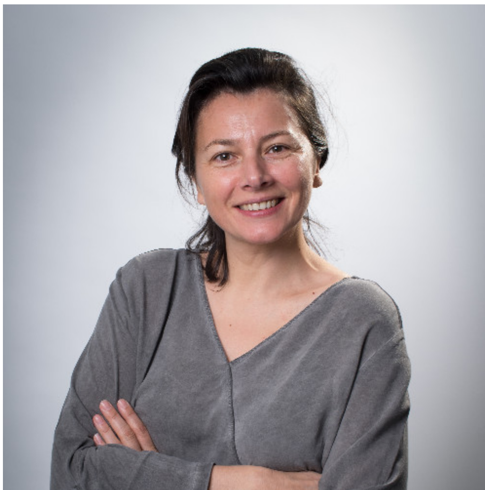
Isabelle Vénuat

Par Isabelle Vénuat , juriste en droit social et rédactrice au sein des Editions Tissot pour RésHebdoEco – www.reso-hebdo-eco.com .