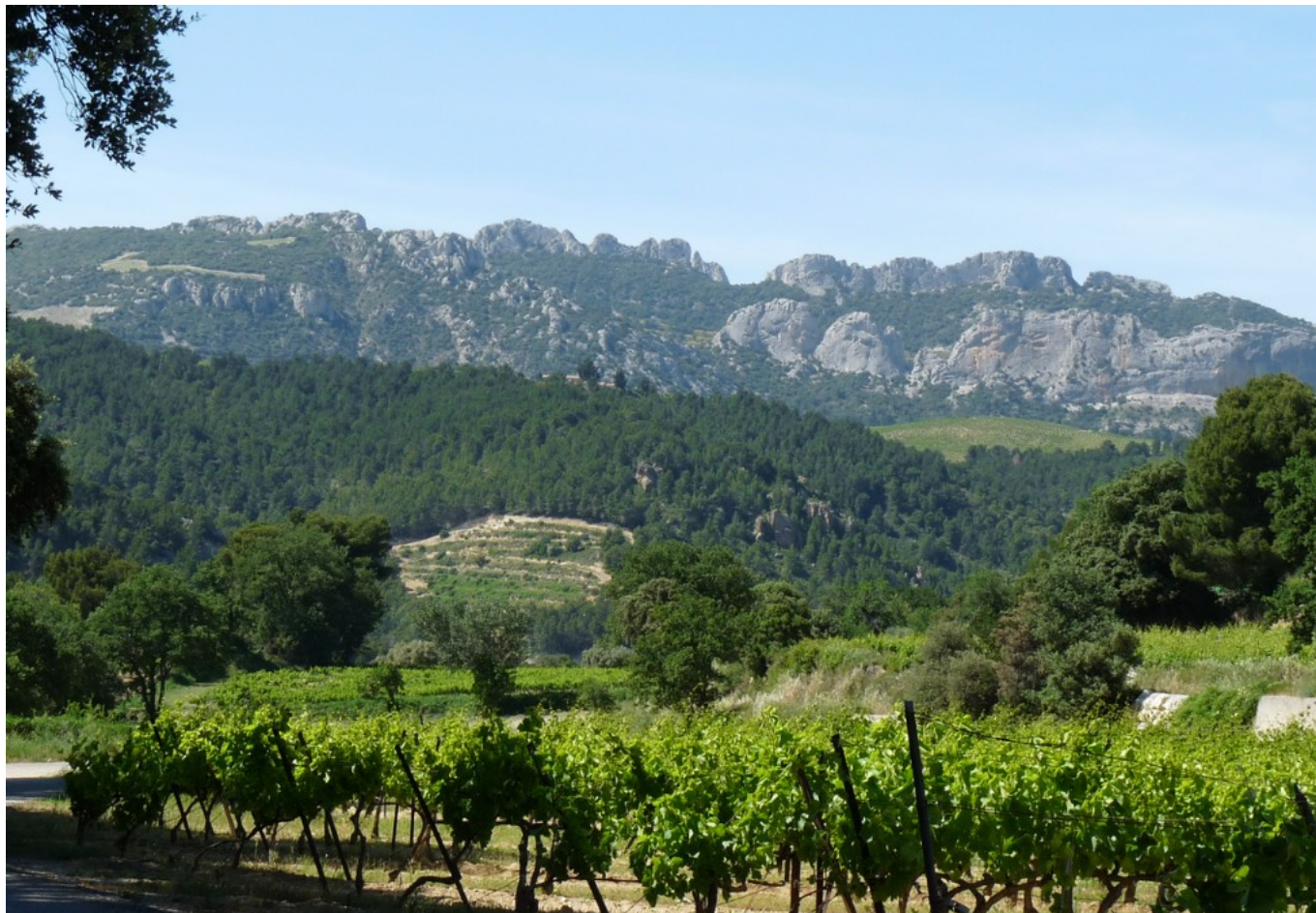
Dentelles de Montmirail

À la suite de l'incendie dévastateur d'août 2021 qui a détruit 240 hectares de forêts, de landes et de vignes, les propriétaires publics et privés se sont réunis au sein de l'Association Syndicale Libre des Dentelles (ASL) pour porter la vision de gestion durable de cet espace remarquable.