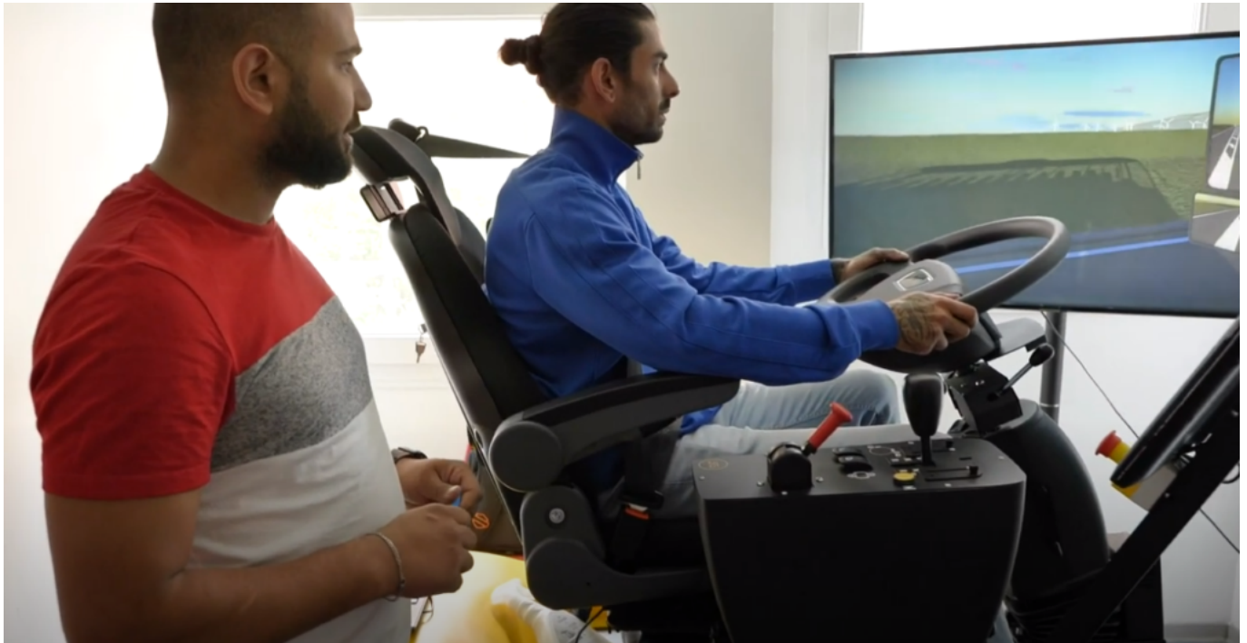
Travail d'apprentissage sur le simulateur de poids lourd

Alès, Béziers et Bagnols-sur-Cèze. Nous opérons de la croissance organique - qui est plus lente- et externe -qui est plus rapide- parce que les deux sont importantes mais ne se structurent pas de la même façon. Le plus important ? Conserver le même modèle structurel et organisationnel.»