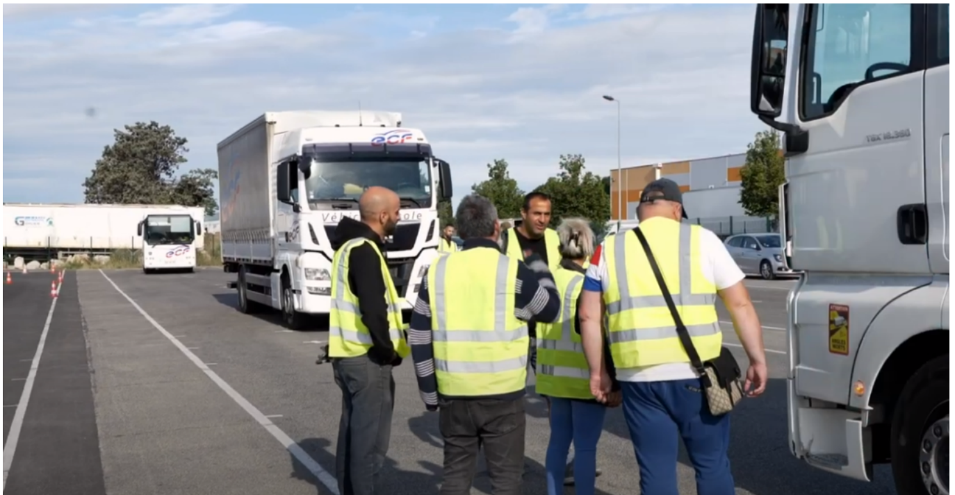
Les stagiaires Chauffeurs poids lourds

«Plutôt bien. Cela fait trois ans que nous préparions cette transmission. Tout d'abord en m'occupant de l'entreprise sur le plan opérationnel, depuis quelques mois en tant que directeur-général, ainsi la transmission s'est faite de manière intuitive et normale. Il n'y a pas eu de rupture avec les collaborateurs, ni avec le réseau national ECF parce que la transmission s'était déjà graduellement faite, avant même qu'elle soit officialisée.»