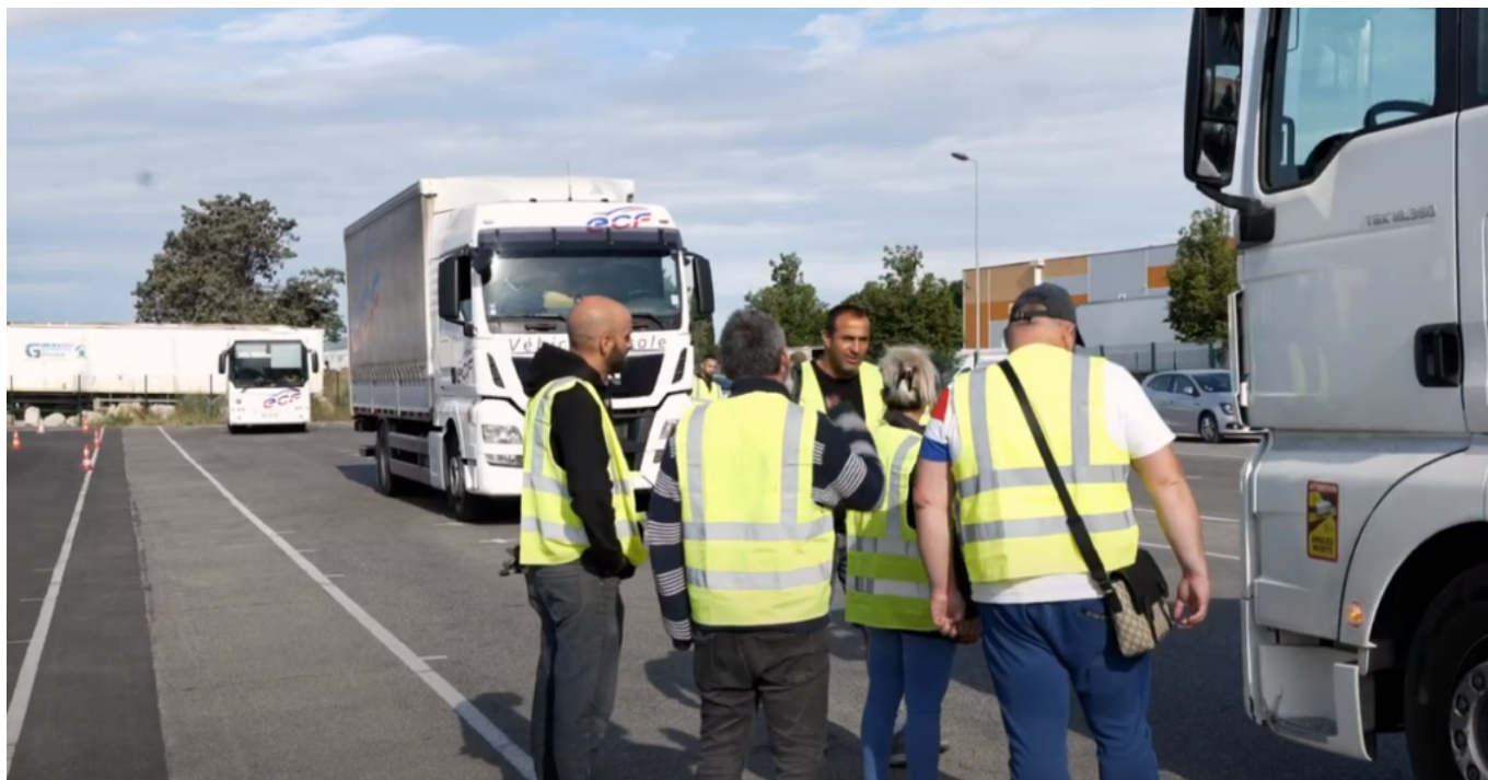
Les stagiaires Chauffeurs poids lourds

«Plutôt bien. Cela fait trois ans que nous préparions cette transmission. Tout d'abord en m'occupant de l'entreprise sur le plan opérationnel, depuis quelques mois en tant que directeur-général, ainsi la transmission s'est faite de manière intuitive et normale. Il n'y a pas eu de rupture avec les collaborateurs, ni avec le réseau national ECF parce que la transmission s'était déjà graduellement faite, avant même qu'elle soit officialisée.»