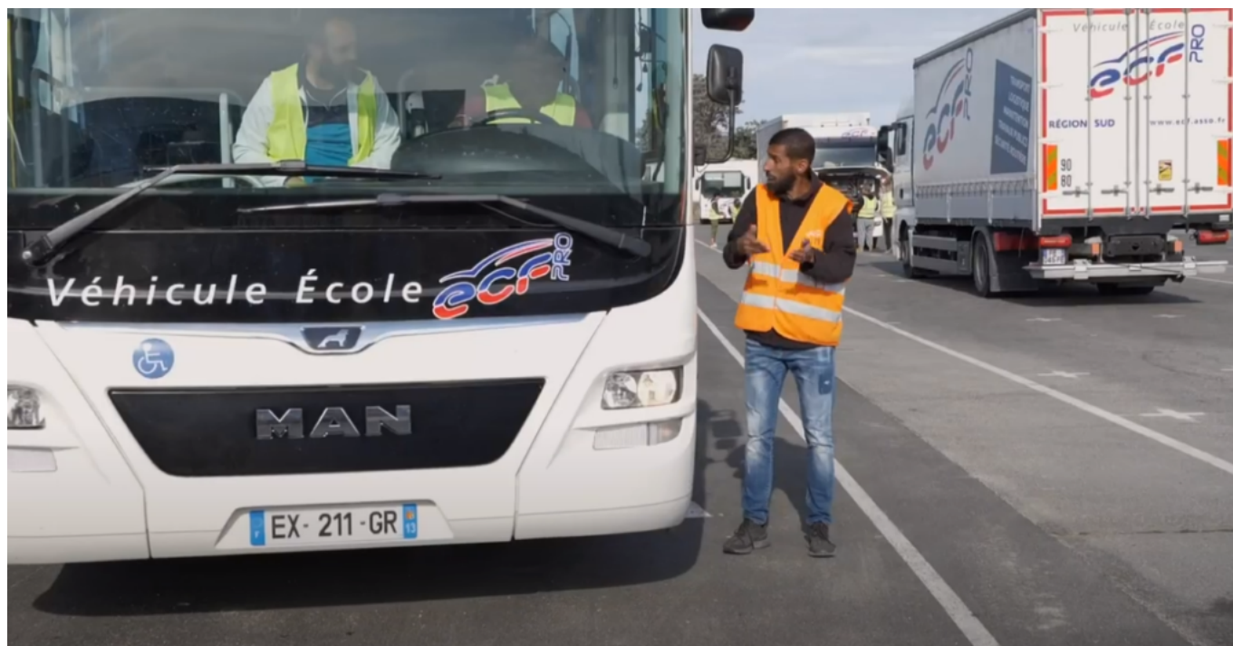
Apprentissage du transport en commun

aux 45 minutes dévolues à l'examen de la conduite. Il faudrait que l'on fasse confiance à l'organisme de formation pour évaluer, pour une partie, le candidat et inclure ce résultat à l'examen final. Ca me semblerait plus cohérent.»