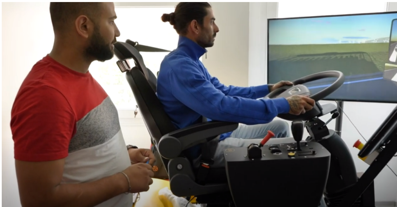
Travail d'apprentissage sur le simulateur de poids lourd

Alès, Béziers et Bagnols-sur-Cèze. Nous opérons de la croissance organique – qui est plus lente- et externe –qui est plus rapide- parce que les deux sont importantes mais ne se structurent pas de la même façon. Le plus important ? Conserver le même modèle structurel et organisationnel.»