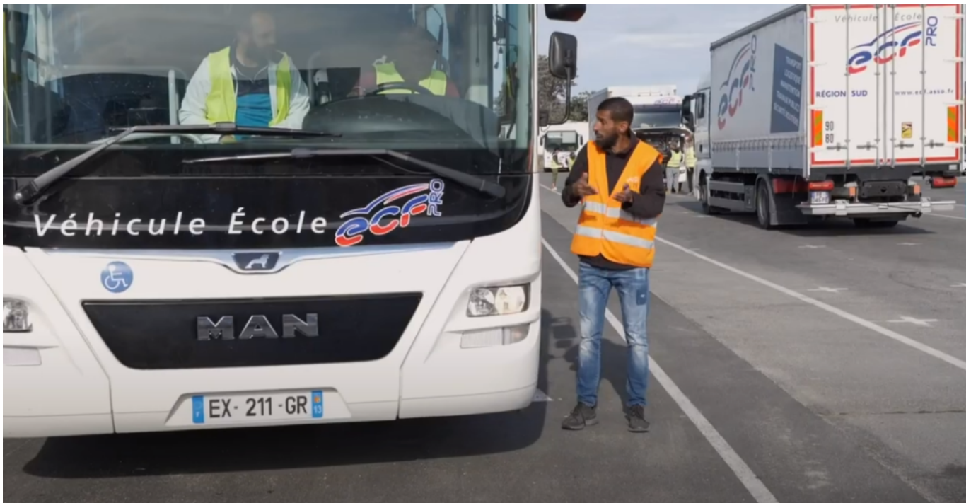
Apprentissage du transport en commun

aux 45 minutes dévolues à l'examen de la conduite. Il faudrait que l'on fasse confiance à l'organisme de formation pour évaluer, pour une partie, le candidat et inclure ce résultat à l'examen final. Ca me semblerait plus cohérent.»