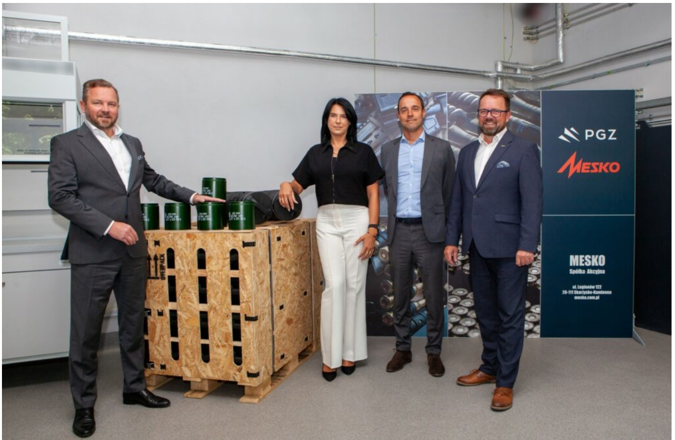
Les responsables de la société polonaise Mesko.