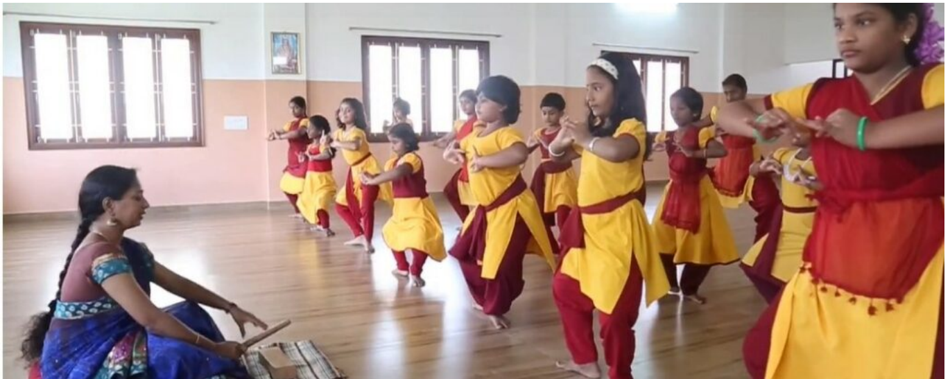
Leçon de danse