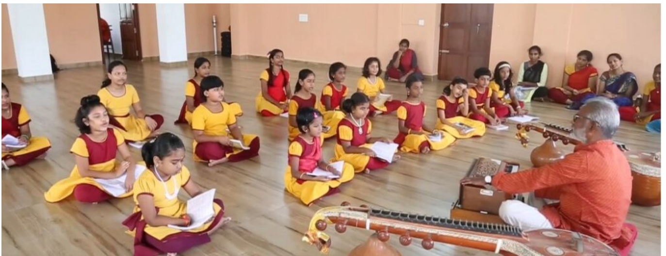
Leçon de chant