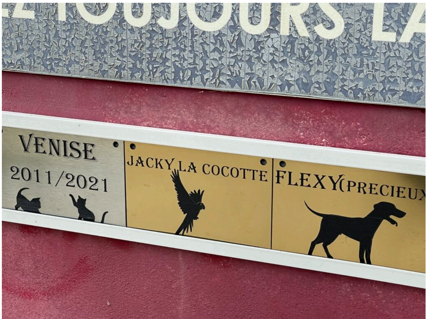
Le mur du souvenir