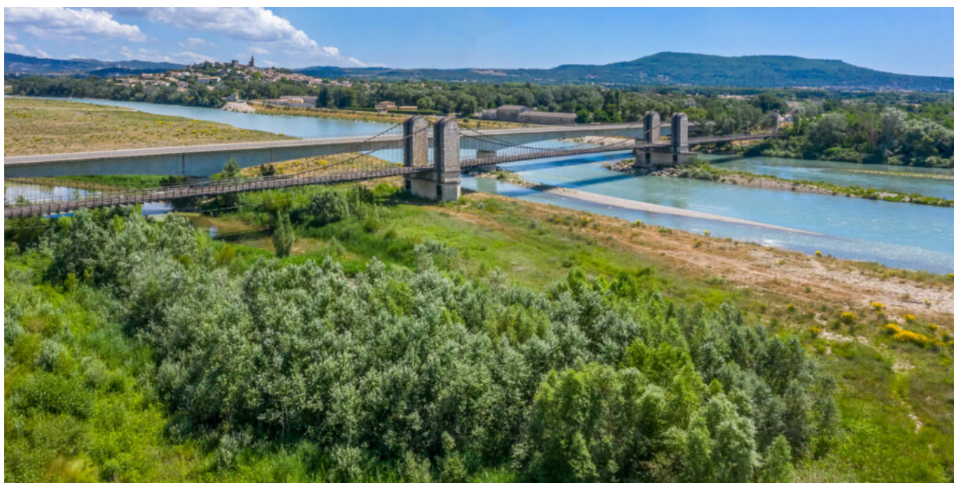
Le pont de Mallemort