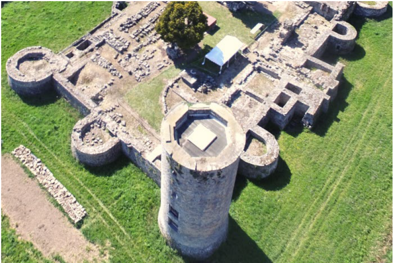
Tour Henri IV, Château de Montagu (91), lauréat 2021 de la Mission Patrimoine