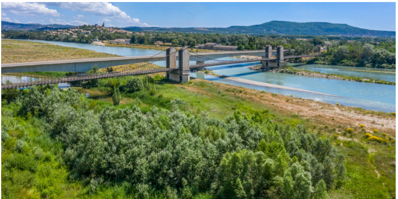
Le pont de Mallemort

Du côté de Carpentras, vous pourrez découvrir un magnifique aqueduc, long de 729 mètres, datant du 18 ème siècle. Lui aussi classé monument historique, il a remplacé un aqueduc enterré datant du moyen âge. Franchissant la rivière Auzon cette construction, due à l'architecte montpellierain Jean de Clapier, servait à alimenter la ville de Carpentras en eau.