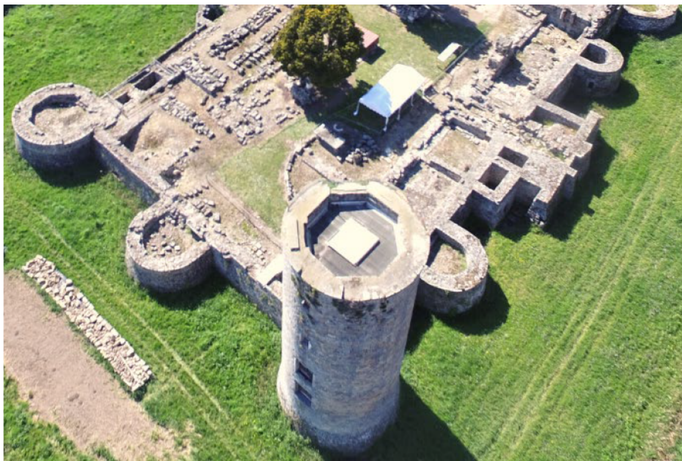
Tour Henri IV, Château de Montagu (91), lauréat 2021 de la Mission Patrimoine