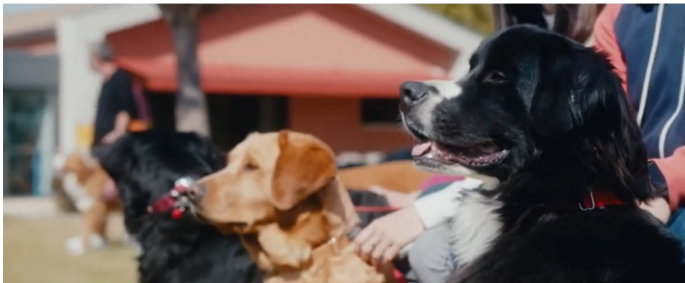
Les chiens guides d'aveugles de la Fondation Gaillanne

Cette année est particulière car en 2020 cette célébration n'a pu avoir lieu suite à la crise sanitaire, en 2021 la fondation mettra donc en avant non pas une promotion mais bien deux ! Sans oublier que la l'association, opérationnelle depuis 2008, a remis son 100ème chien guide en avril dernier.