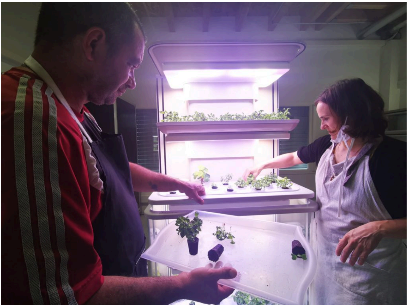
Chaque plante est méticuleusement testée.