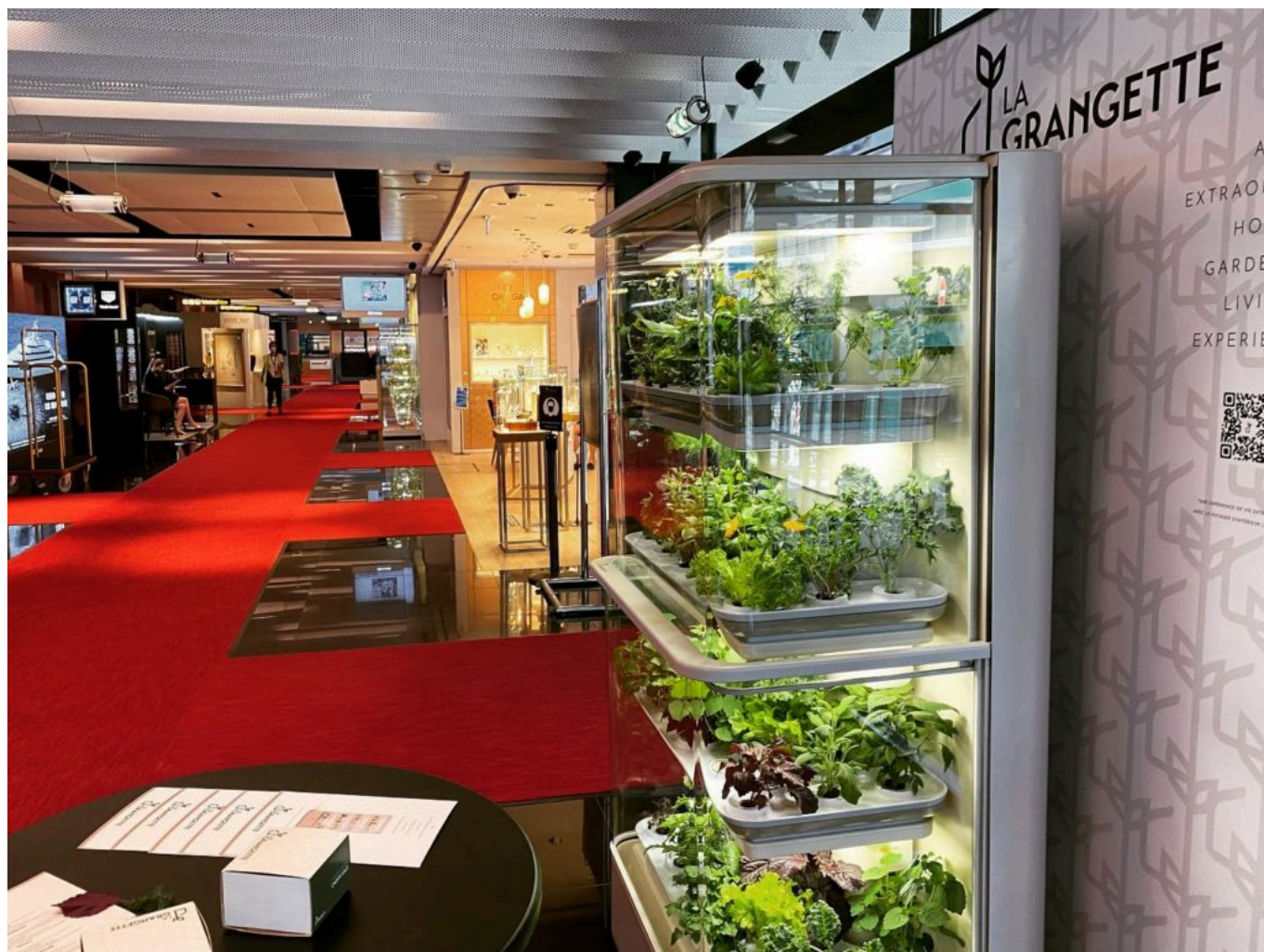
Exposition au terminal d'affaires de Nice.