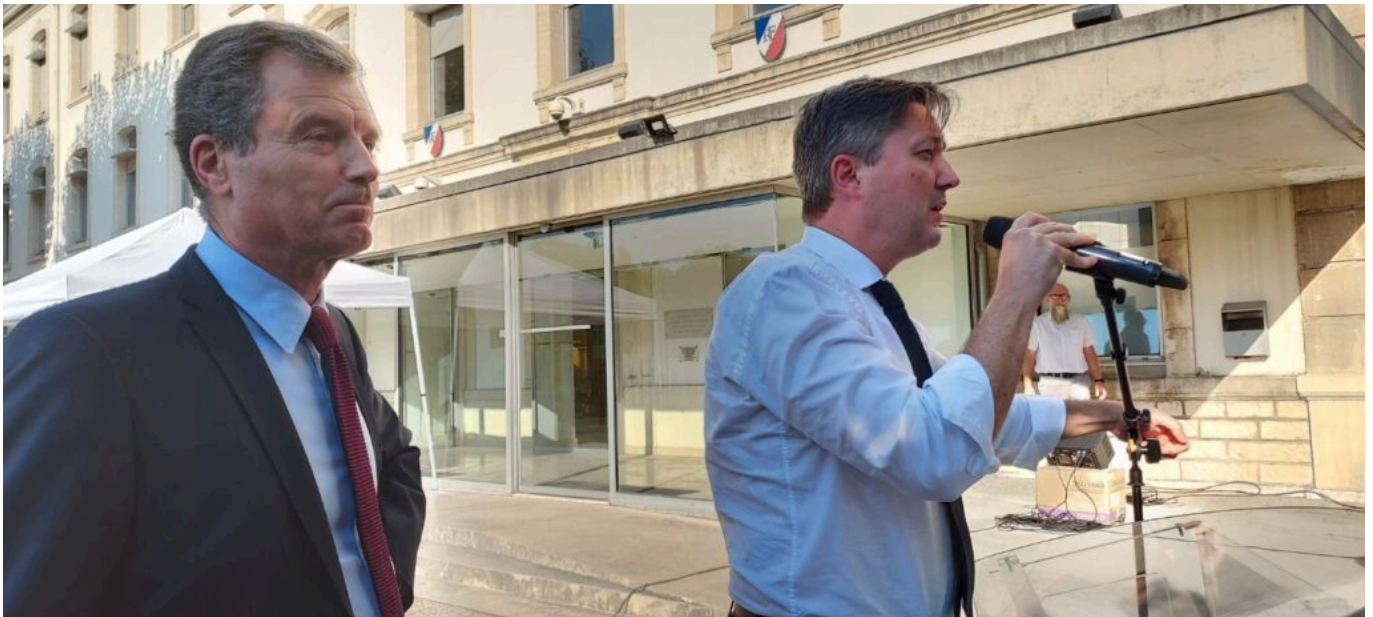
Le préfet de Vaucluse en compagnie du préfet de région (à gauche avec la cravate rouge).