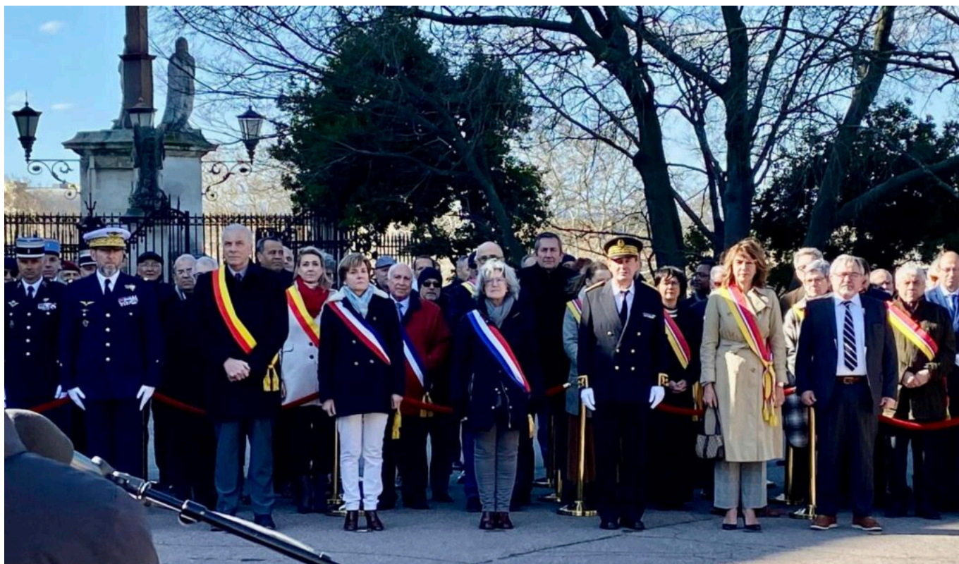
Le nouveau préfet avec les élus de Vaucluse ainsi que les représentants des services de l'Etat.

« Je suis touché par votre accueil, vous avez pris la peine de venir à notre première rencontre, a expliqué Thierry Suquet pour ses premiers pas en Vaucluse. C'est un plaisir d'avoir été nommé ici, cela prouve la confiance du président de la République et du ministre de l'Intérieur et des Outre-mer. C'est à la fois un honneur et une responsabilité. »