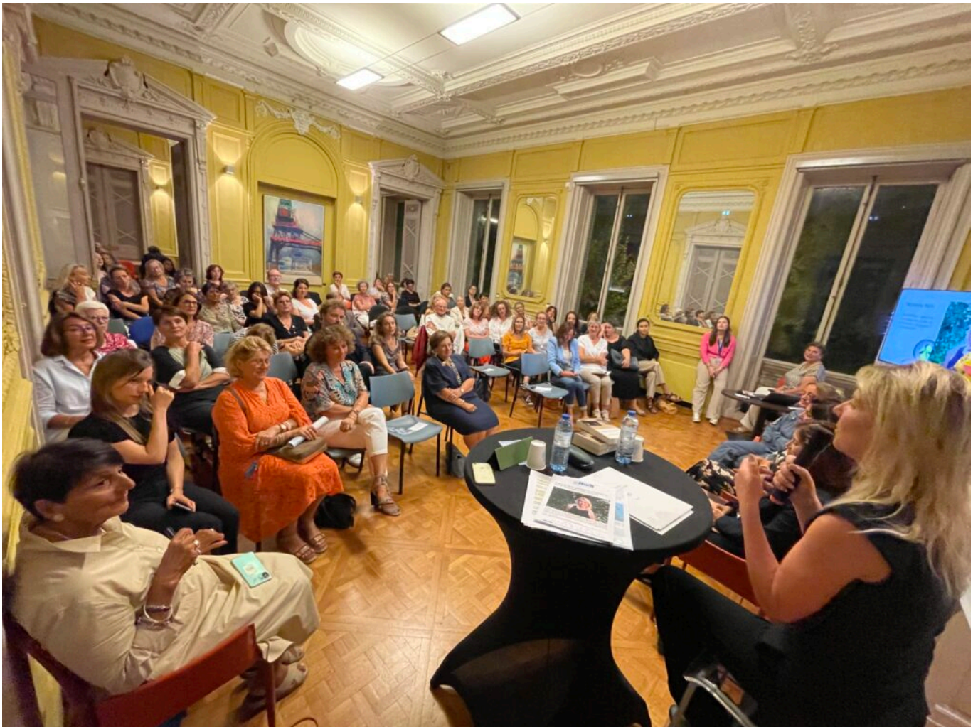
Les parcours inspirants de femmes leaders