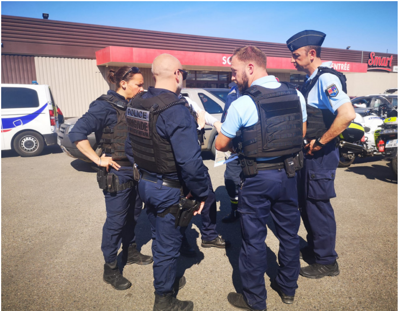
Brigade d'intervention