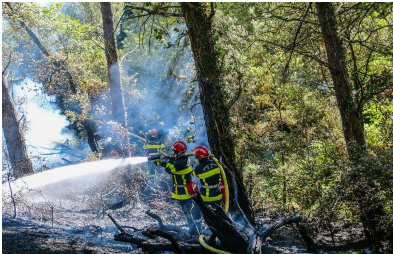
Feu de broussailles à Cairanne durant l'été 2020

Parmi les 185 nouveaux gardes régionaux, 46 protégeront les massifs du Vaucluse, dont 5 gardes régionaux déployés dans le pays de Sorgues, 24 mobilisés au parc naturel régional du Lubéron et 17 au parc naturel régional du Ventoux.