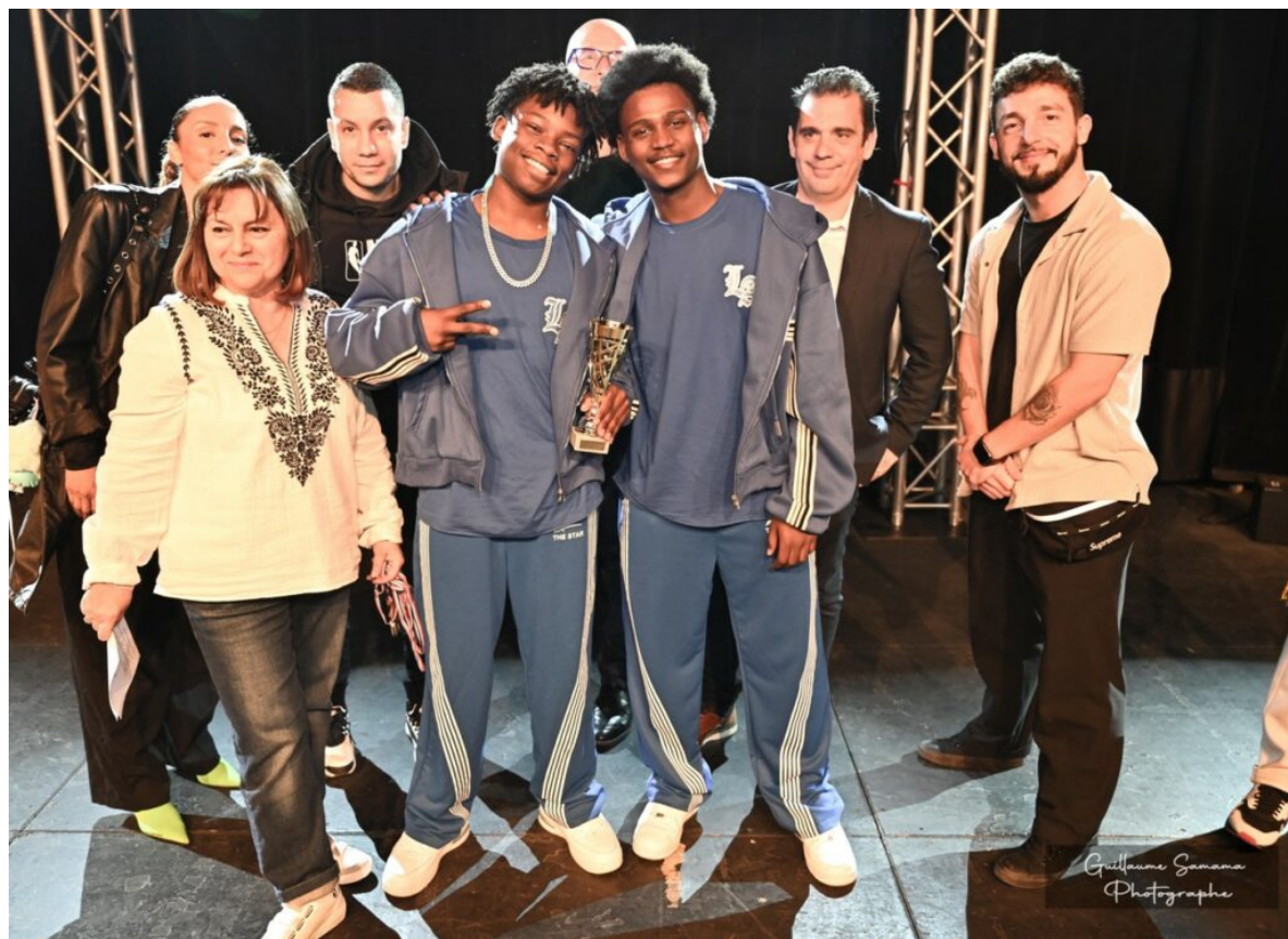
Les Two Black Brothers de l'école LNB de Bagnols-sur-Cèze.