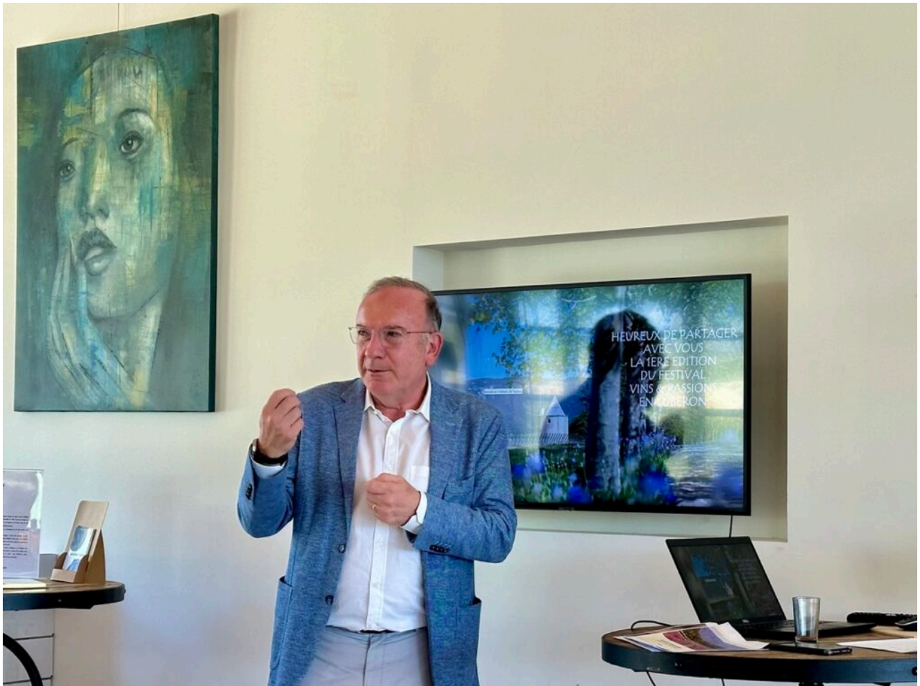
Pierre Gattaz lors de la présentation de l'événement aux vignerons, producteurs et experts participants, aux partenaires et à la presse.