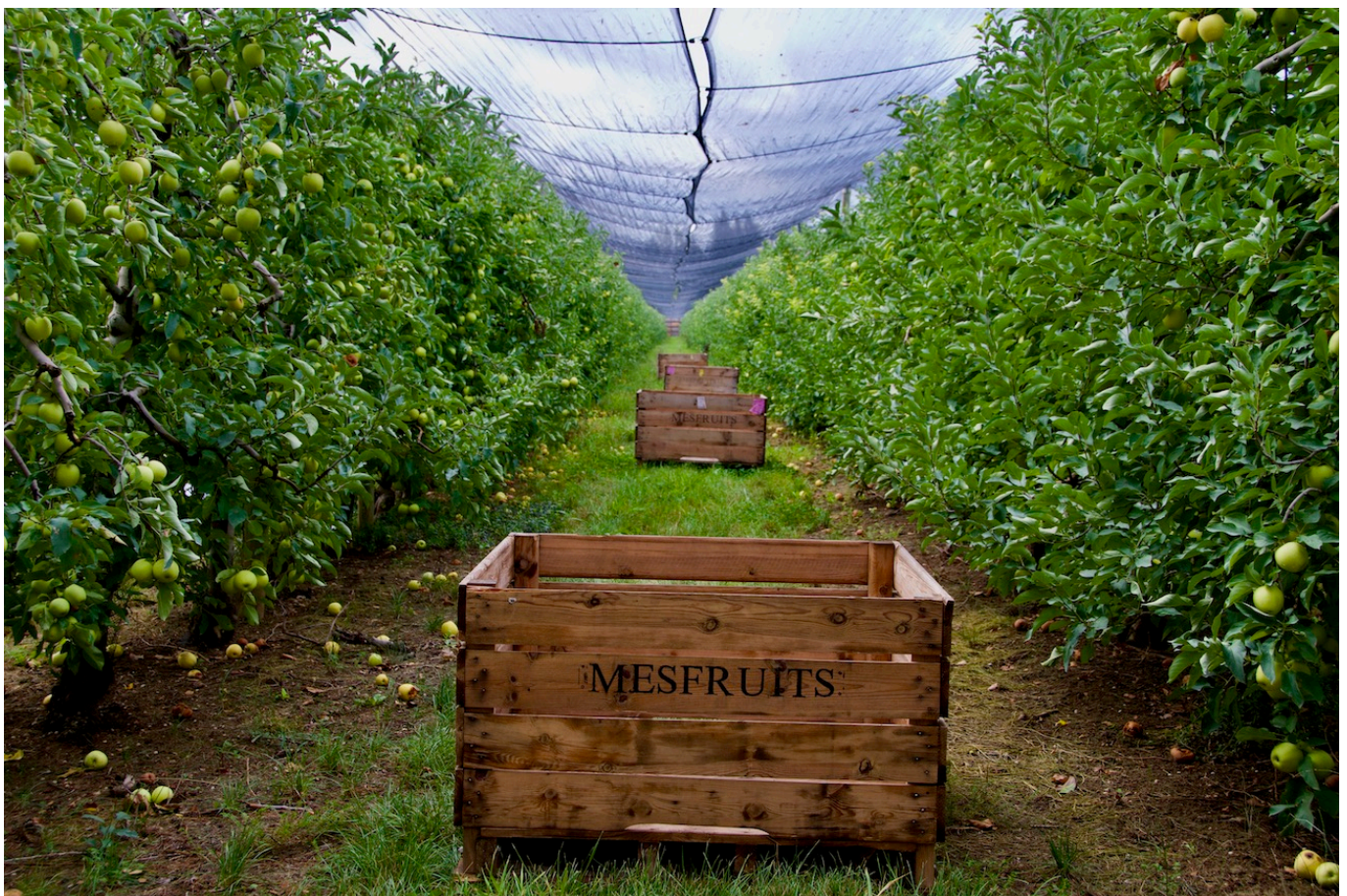
Mesfruits compte 500 hectares de vergers et 15 variétés de pommes.