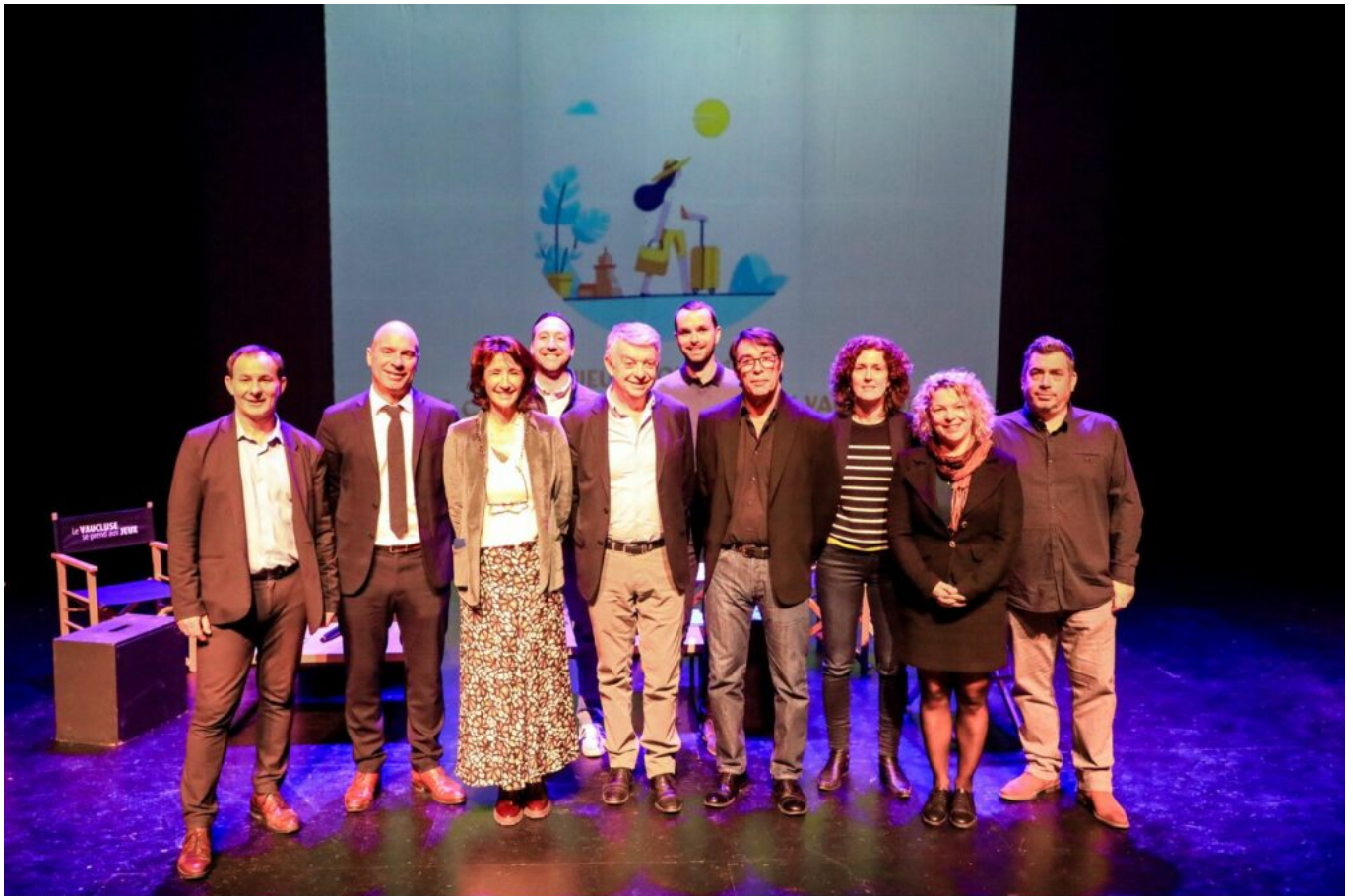
HOCQUEL A - VPA

Le 12 mars dernier, l'agence du développement, du tourisme et des territoires Vaucluse Provence Attractivité a réuni ses partenaires du monde du tourisme à l'Auditorium Jean-Moulin du Thor lors d'un rendez-vous appelé « Mieux connaître les clientèles touristiques en Vaucluse. »