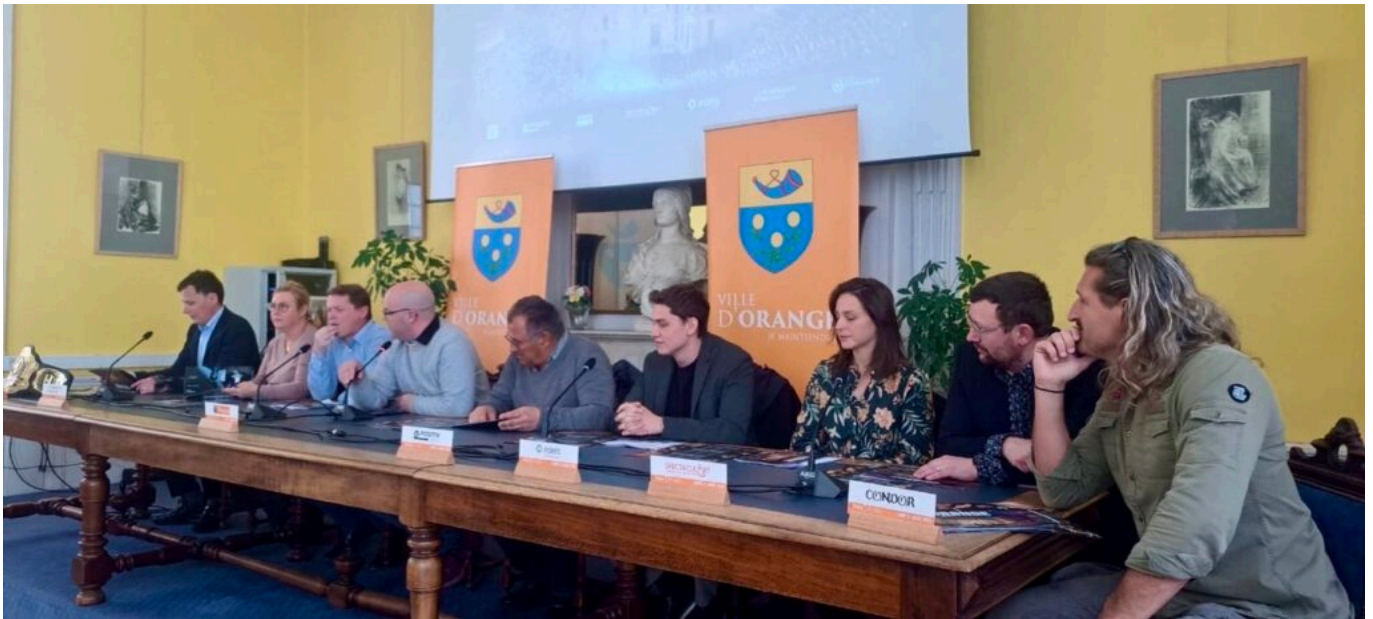
Les organisateurs des différentes manifestations de cet été autour du maire d'Orange.