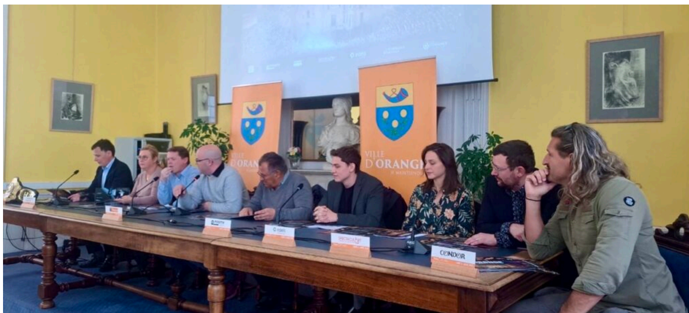
Les organisateurs des différentes manifestations de cet été autour du maire d'Orange.