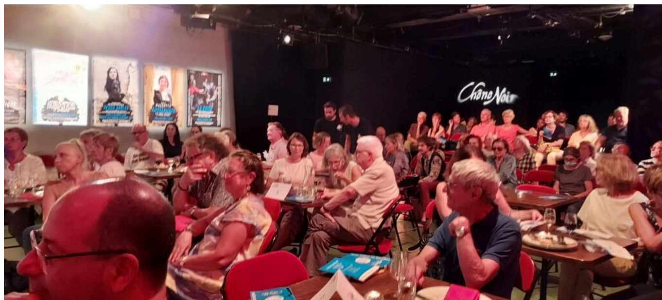
Le public lors de la présentation.