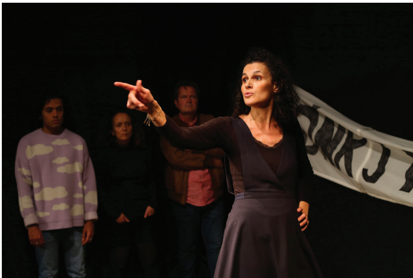
Le jour où mon père m'a tué, Théâtre des halles

d'Avignon et des théâtres engagés dans cette démarche. La présentation de cette édition virtuelle avait été suivie d'un grand rassemblement sur la place du Palais des Papes pour appeler à résister et à ré-ouvrir les lieux culturels : «Ici à Avignon, nous voulons réaffirmer que la culture est vitale, essentielle à nos vies, à notre équilibre... Nous ne pouvons pas nous passer de culture. Nous ne pouvons imaginer, penser notre ville et notre pays sans culture. Elle donne sens à nos existences. Elle ouvre nos esprits. Elle nourrit nos pensées. Elle favorise les rencontres et les découvertes. Sans culture, il n'y a ni liberté ni émancipation.» Tels étaient les premiers mots de ce Manifeste avec pour premiers signataires Le Maire d'Avignon et les directeurs des scènes permanentes.