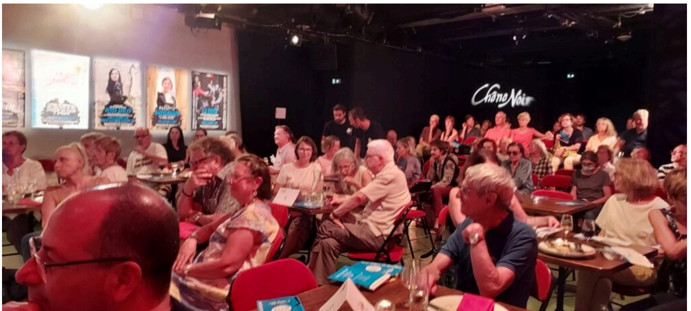
Le public lors de la présentation.