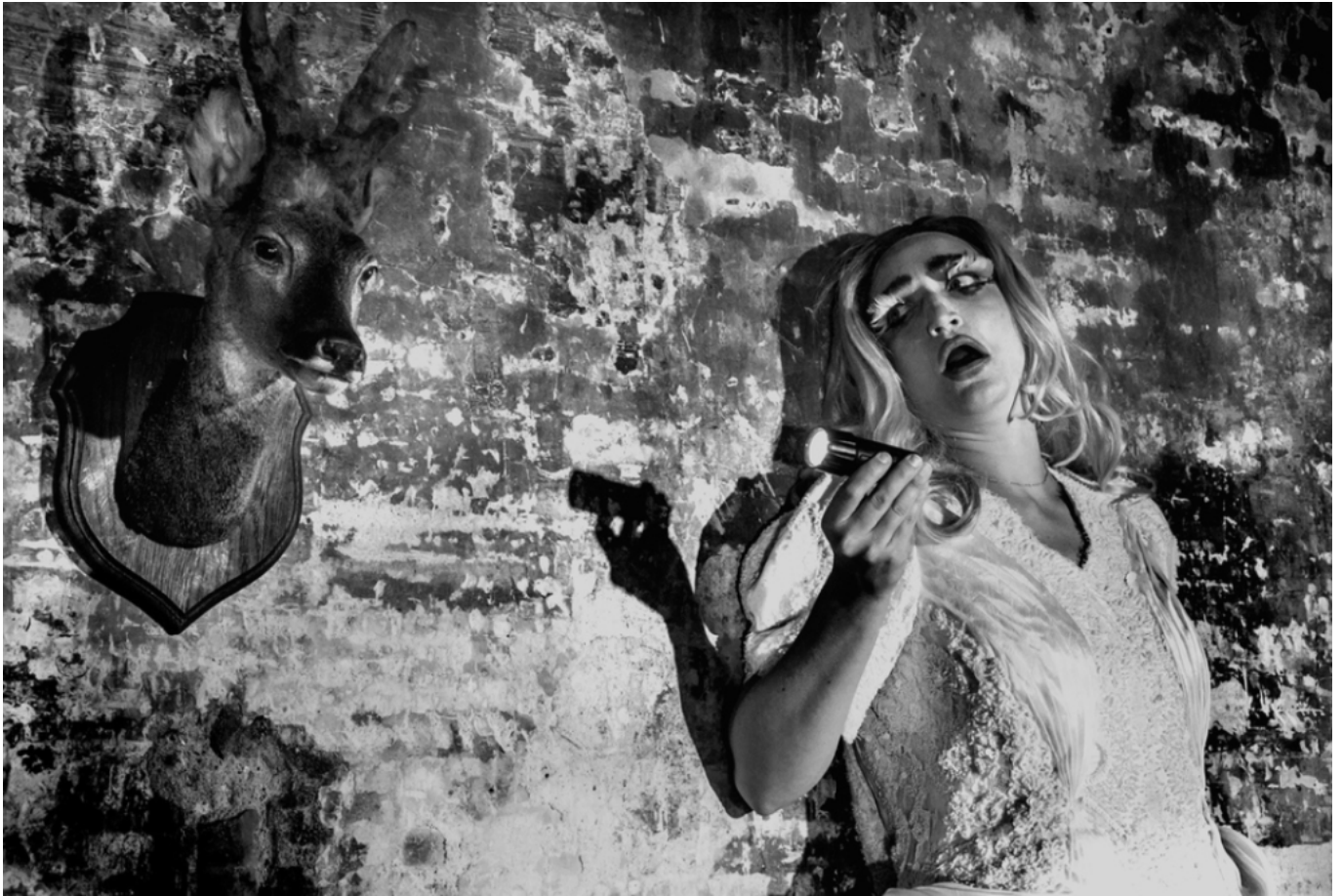
Le Chevreuil et Dalida, Artéphile