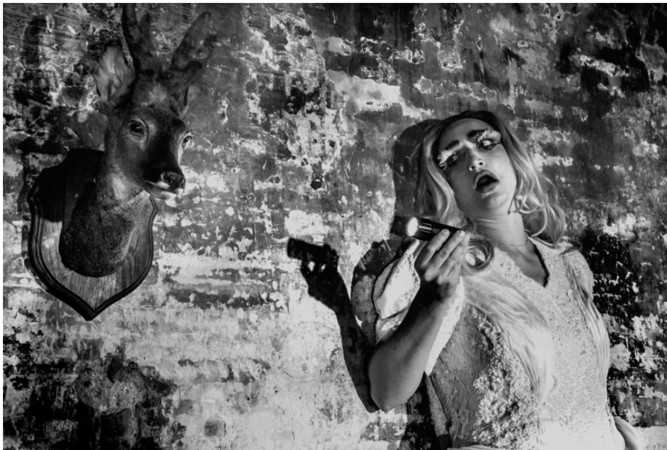
Le Chevreuil et Dalida, Artéphile