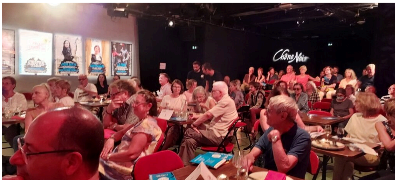
Le public lors de la présentation.