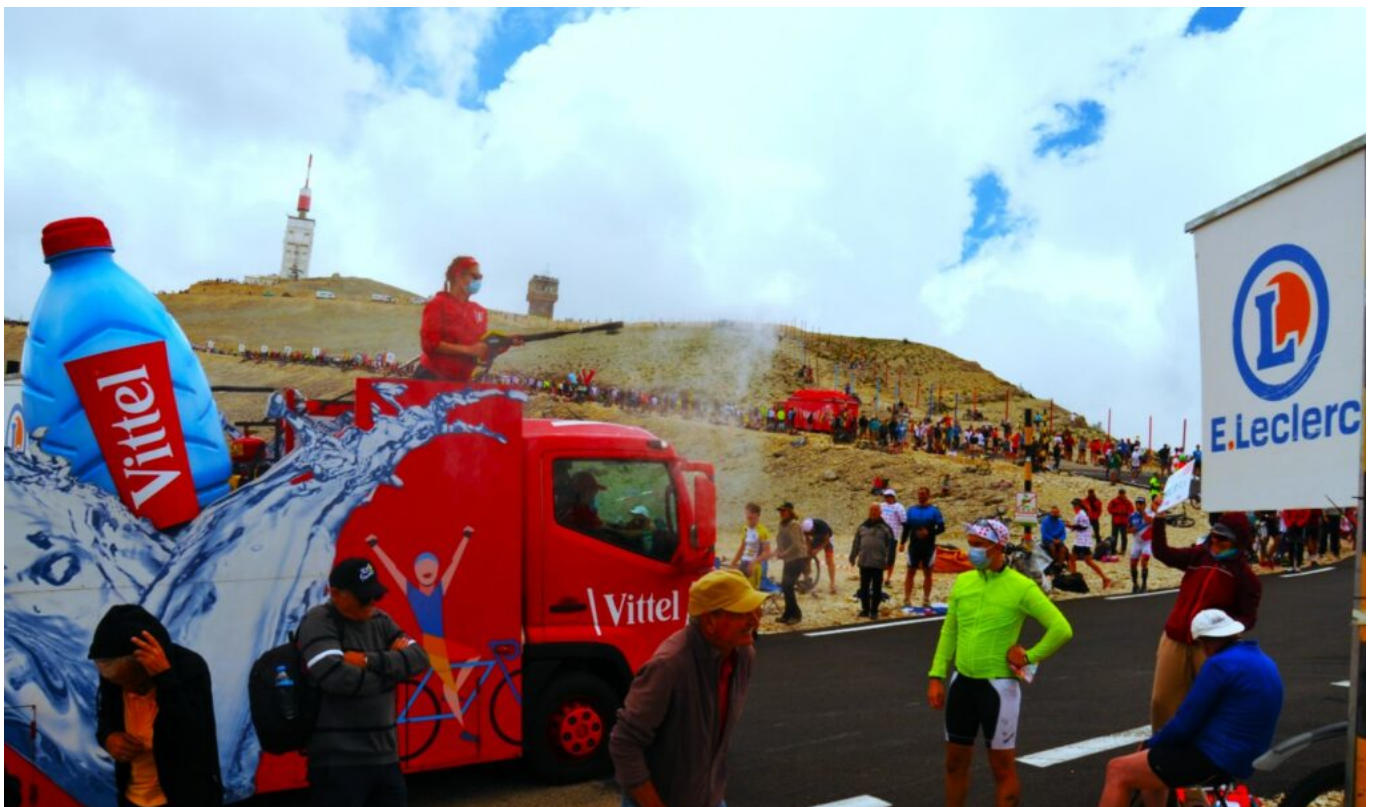
La caravane du Tour de France en 2021.

C'est ce qu'a bien compris le Département de Vaucluse qui y voit l'opportunité de faire la promotion du cyclotouriste sur son territoire. En effet, après chaque présence du Ventoux, les chiffres de fréquentation des cyclotouristes sont en hausse pour atteindre plus de 120 000 cyclistes le gravissant désormais chaque année.