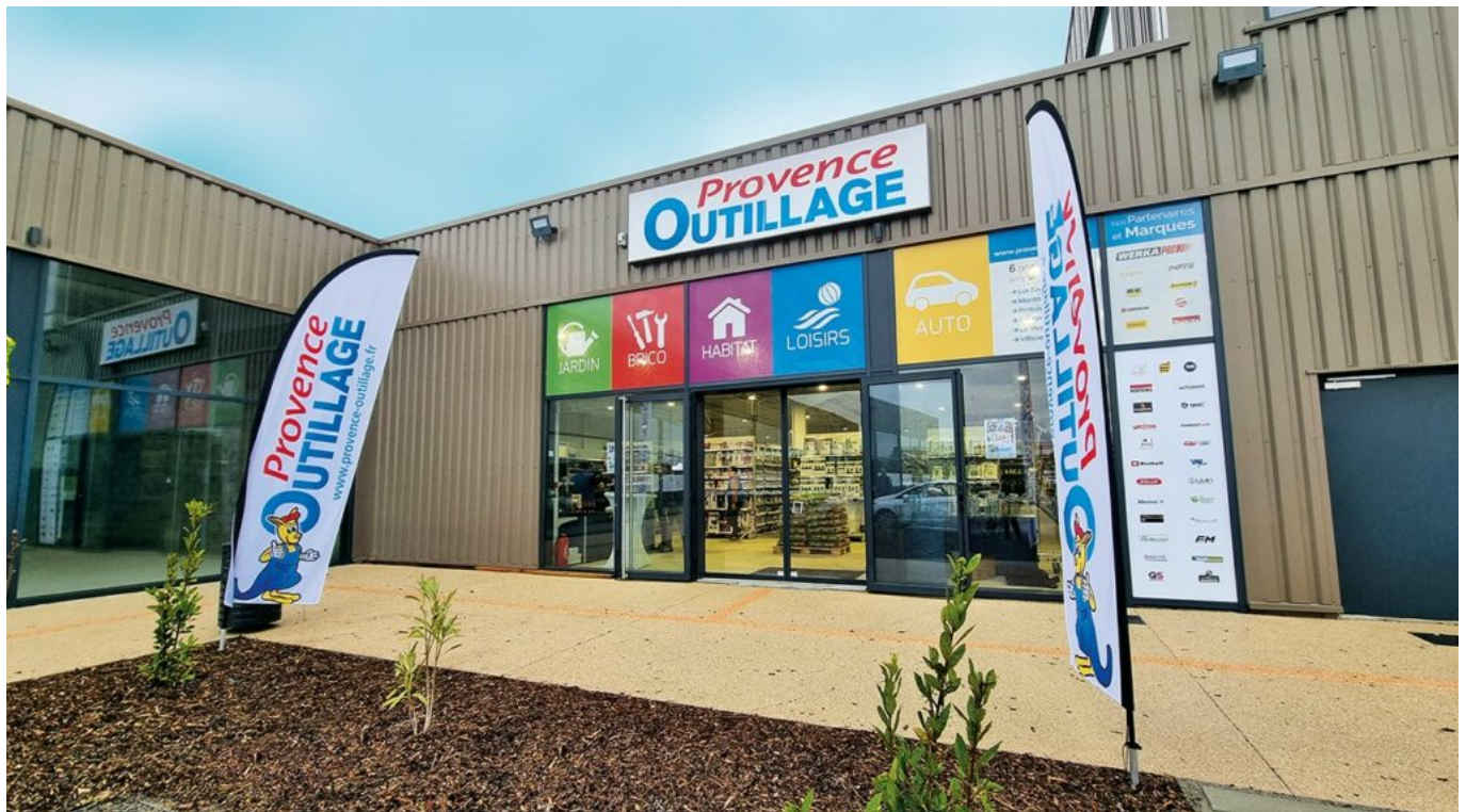
Le magasin de Montoux.

« Il y a aussi des temps forts pour nos ventes, comme la fête des pères et les soldes. 50% de notre chiffre d'affaires proviennent du site en ligne, 25 à 28% des magasins et le reste de notre propre marque fournie à d'autres. » Le chiffre d'affaires tourne autour de 16M€.