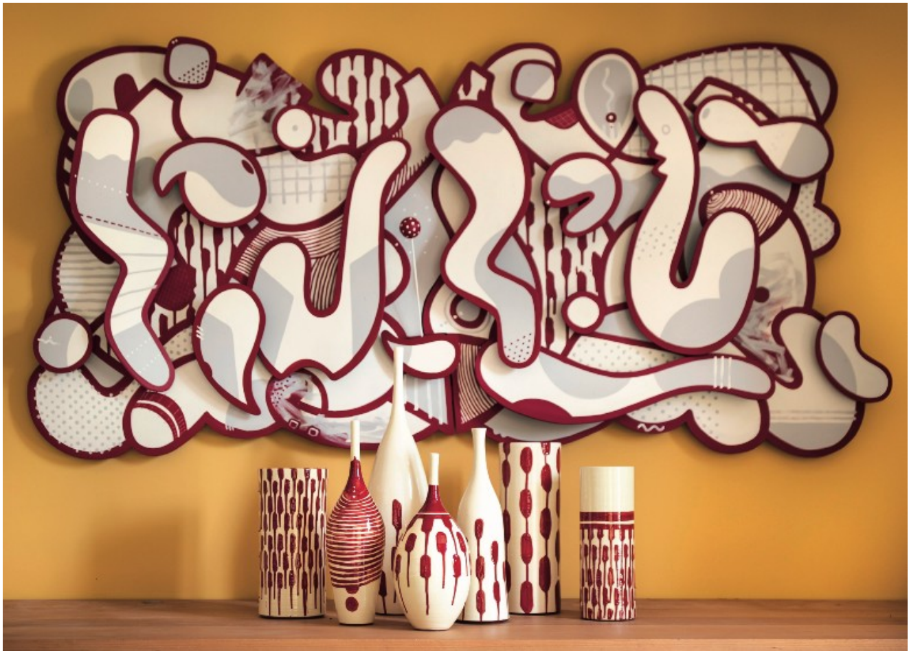
'Mondo Vision' de Mambo