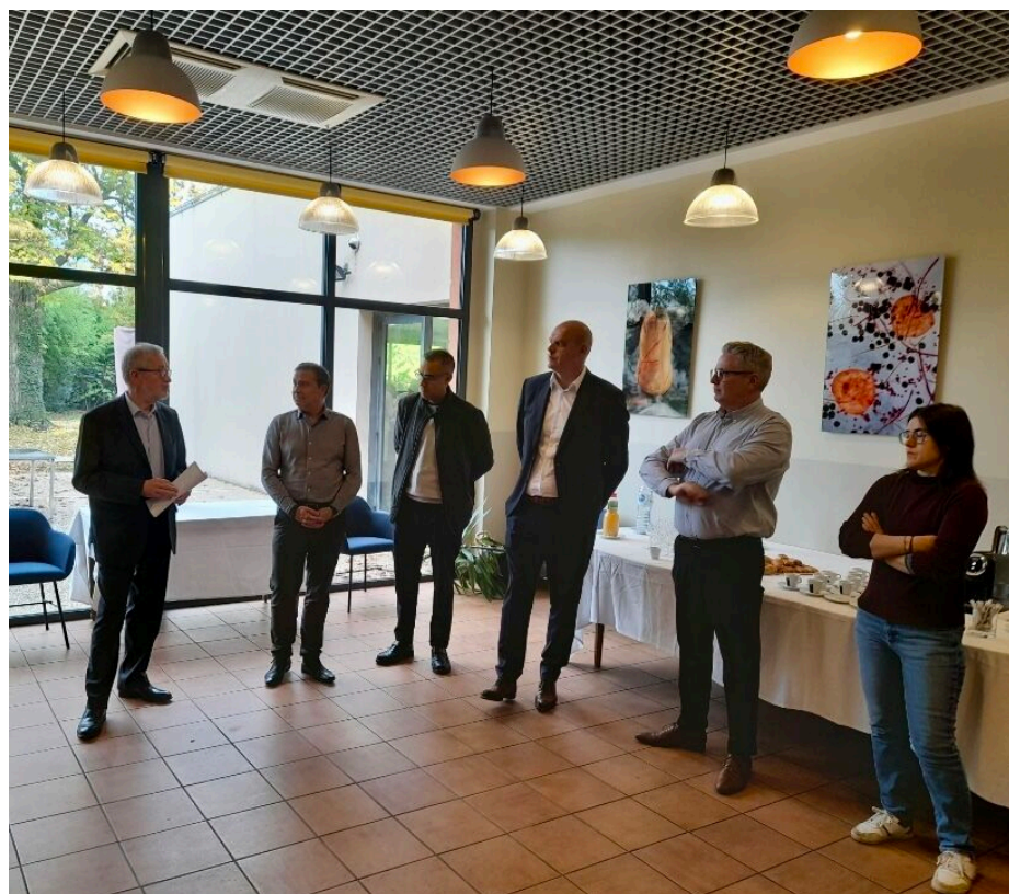
Le lancement officiel de la première session du Campus Pyro à Avignon.

« Cette ouverture représente une belle synergie entre les besoins d'industriels du secteur pyro et le campus », se félicite le Campus Pyro également ravi de l'accueil de la CCI 84.