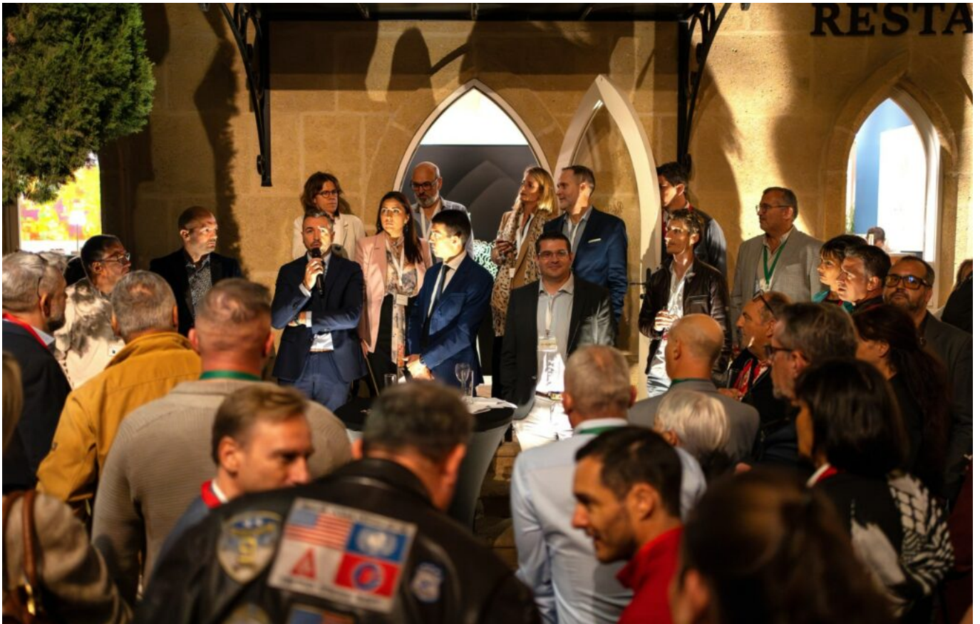
Une soirée grand format aux Fines Roches à Châteauneuf-du-Pape.

« Adhérer à un réseau de chef d'entreprise c'est un acte de bonne gestion. »