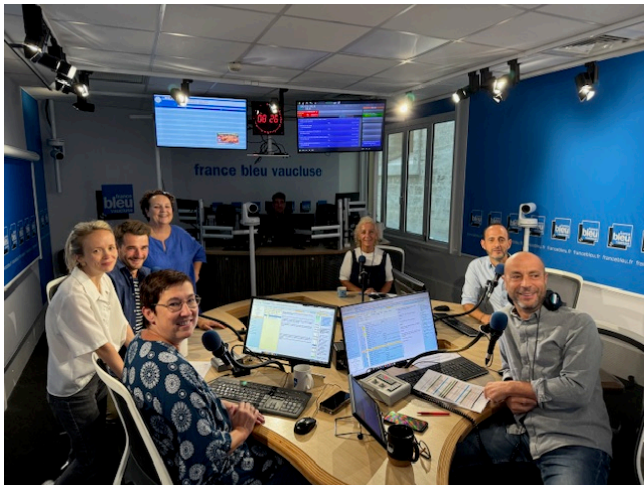
L'équipe des matinales de France bleu Vaucluse.