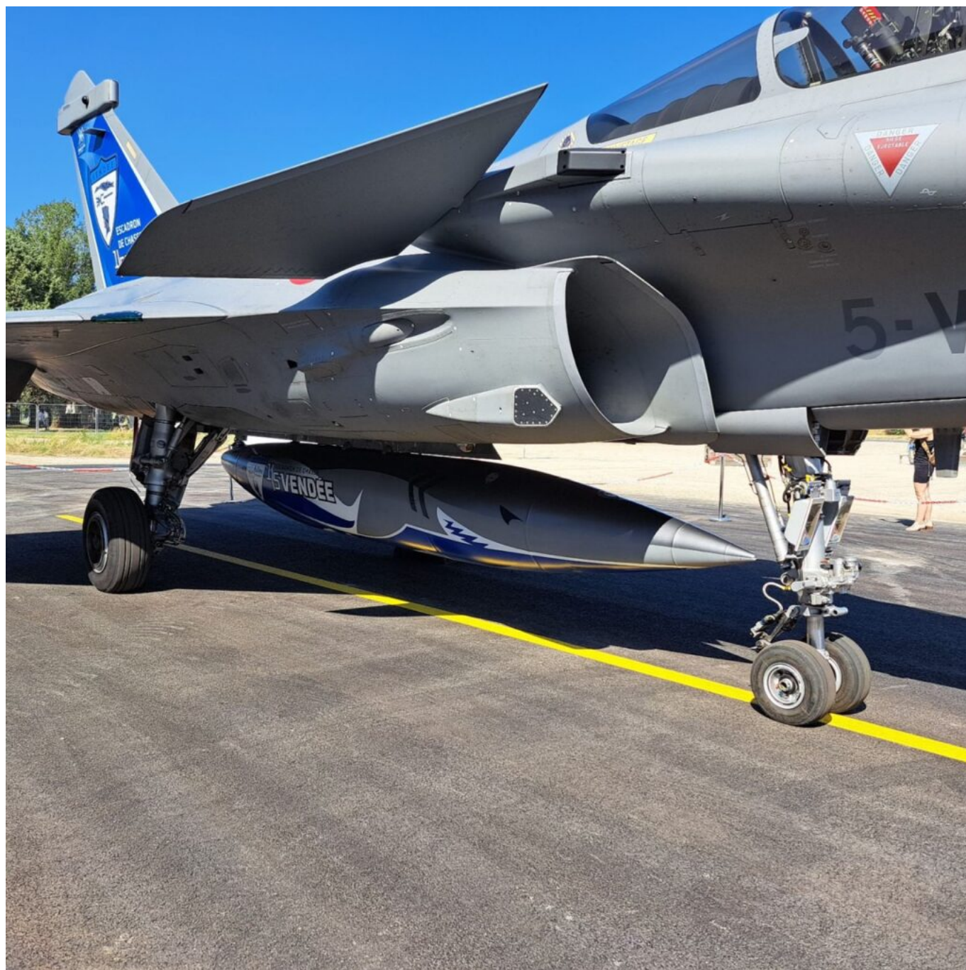
L'armement du Rafale.

L'arrivée du Rafale inaugurée par le Chef d'État-Major de l'Armée de l'Air et de l'Espace