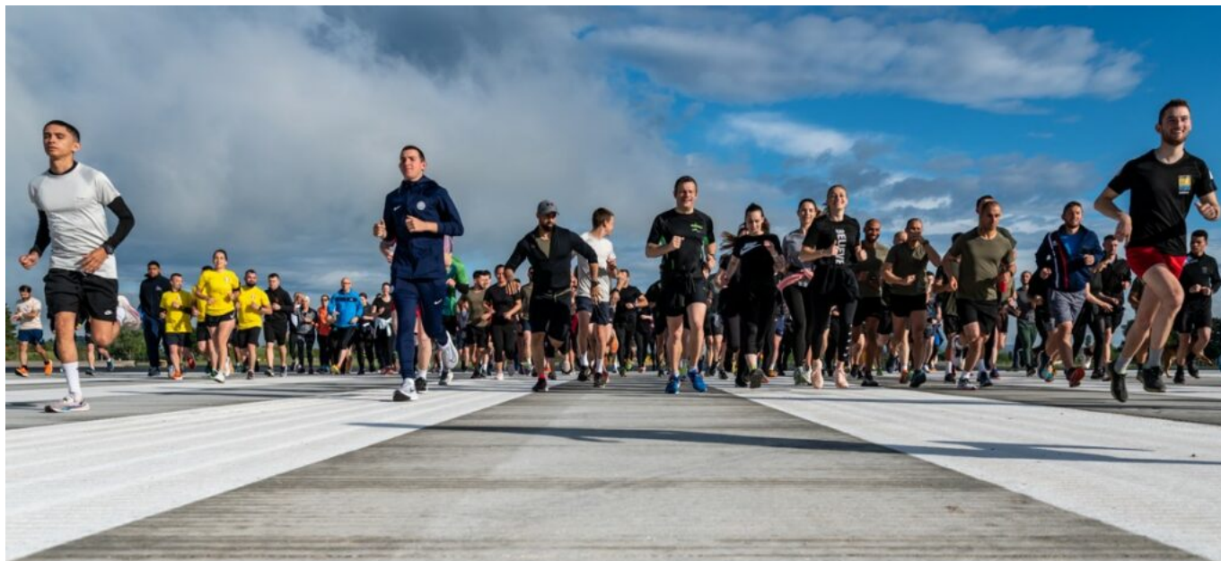
Les participants à la course sur la piste de la base.