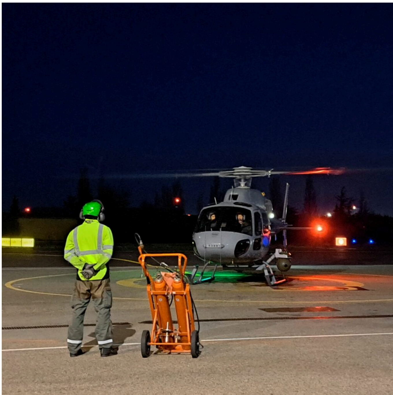
Décollage d'un Fennec avec un 'chien jaune' qui guide le pilote.