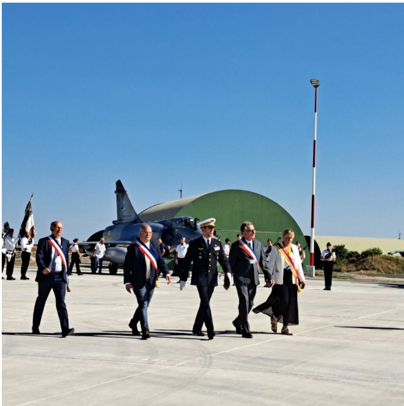
Yann Bompard, maire d'Orange (2e à gauche).