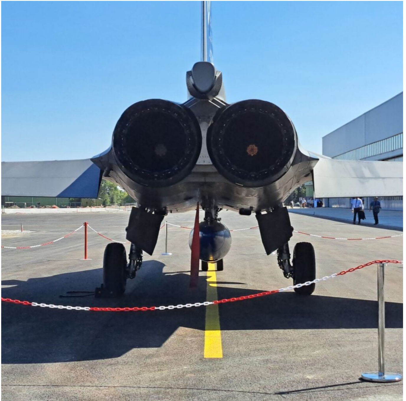
Les réacteurs du Rafale.

Mont-de-Marsan à être équipé de Rafale avec pour triple mission : la posture 24h/24 de l'espace aérien français, l'aide aux aéronefs en difficulté et l'interception face aux intrusions malveillantes. Un aéronef qui vole à Mach 1,8 (2223 km/h) et a une autonomie de 3 700 km.