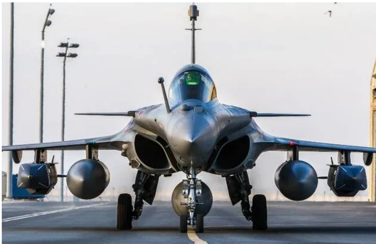
Le rafale remplace le Mirage 2000