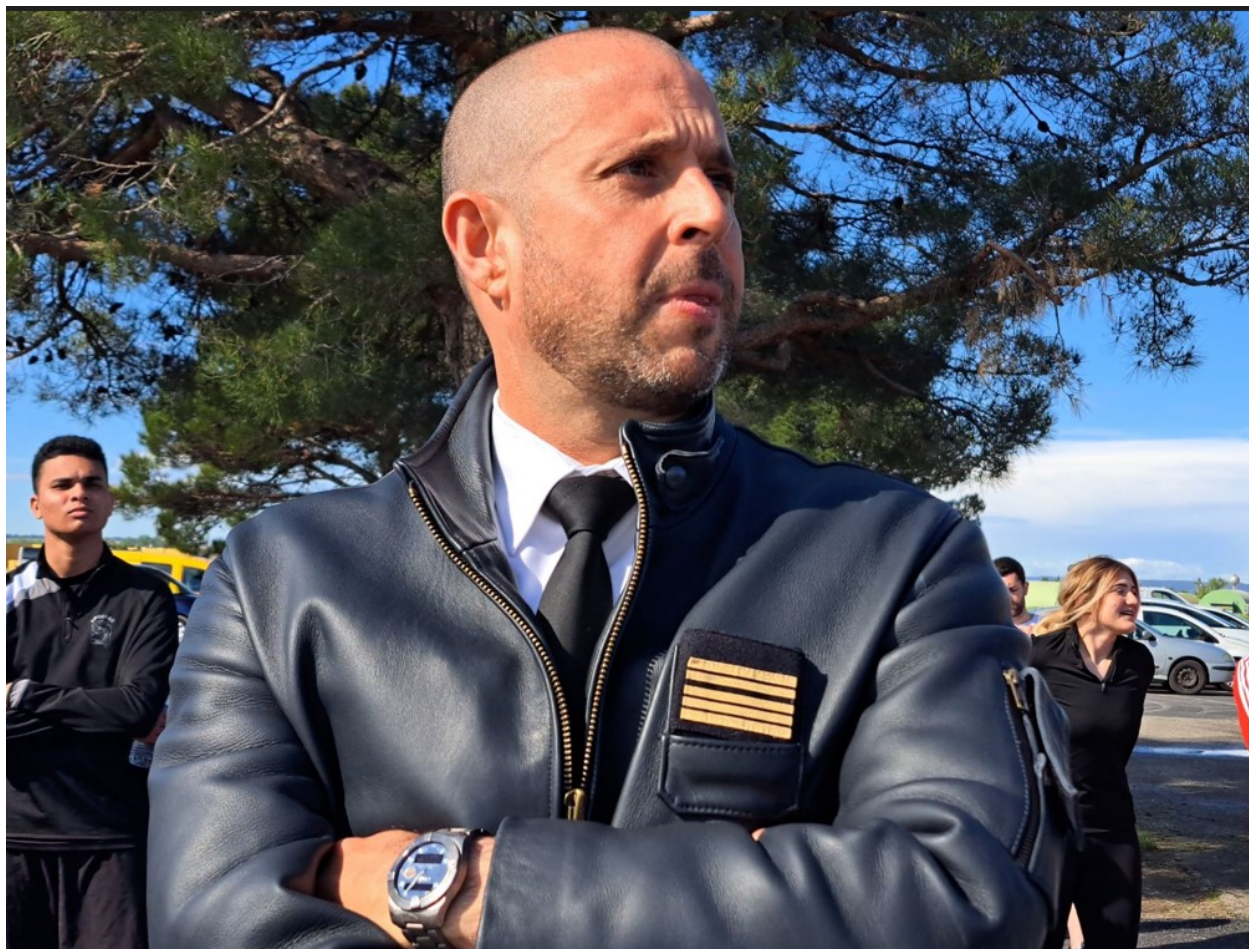
Le colonel Guillaume Deschamps .

L'occasion de faire le point sur les lourds travaux de modernisation de la BA 115 avec le patron, le colonel Deschamps. « Pour ce chantier RAF 5 destiné à accueillir cet été les Rafale de la 5e escadre de Chasse et l'Escadron de chasse 1/5 Vendée , 180M€ ont été engagés. Sur les 317 hectares de superficie de la base, 250 hectares ont été impactés par ce chantier XXL. Depuis la pose de la 1ère pierre de cet immense chantier, le 1er février 2023, Jusqu'à 600 ouvriers ont été présents sur le site chaque jour pour mener à bout la remise en état des bâtiments, des réseaux, des canalisations et de la voirie. Une centrale à béton a même été construite sur place dans un souci d'efficacité. Tout ou presque a été détruit et reconstruit : la piste qui a été rallongée en 11 mois, un vrai billard !