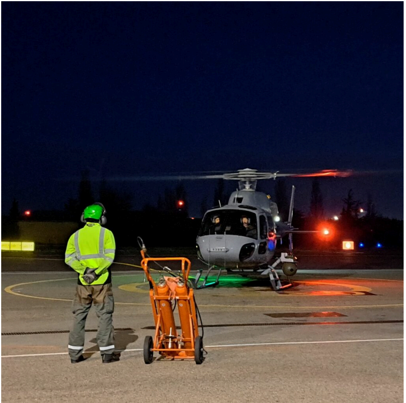
Décollage d'un Fennec avec un 'chien jaune' qui guide le pilote.