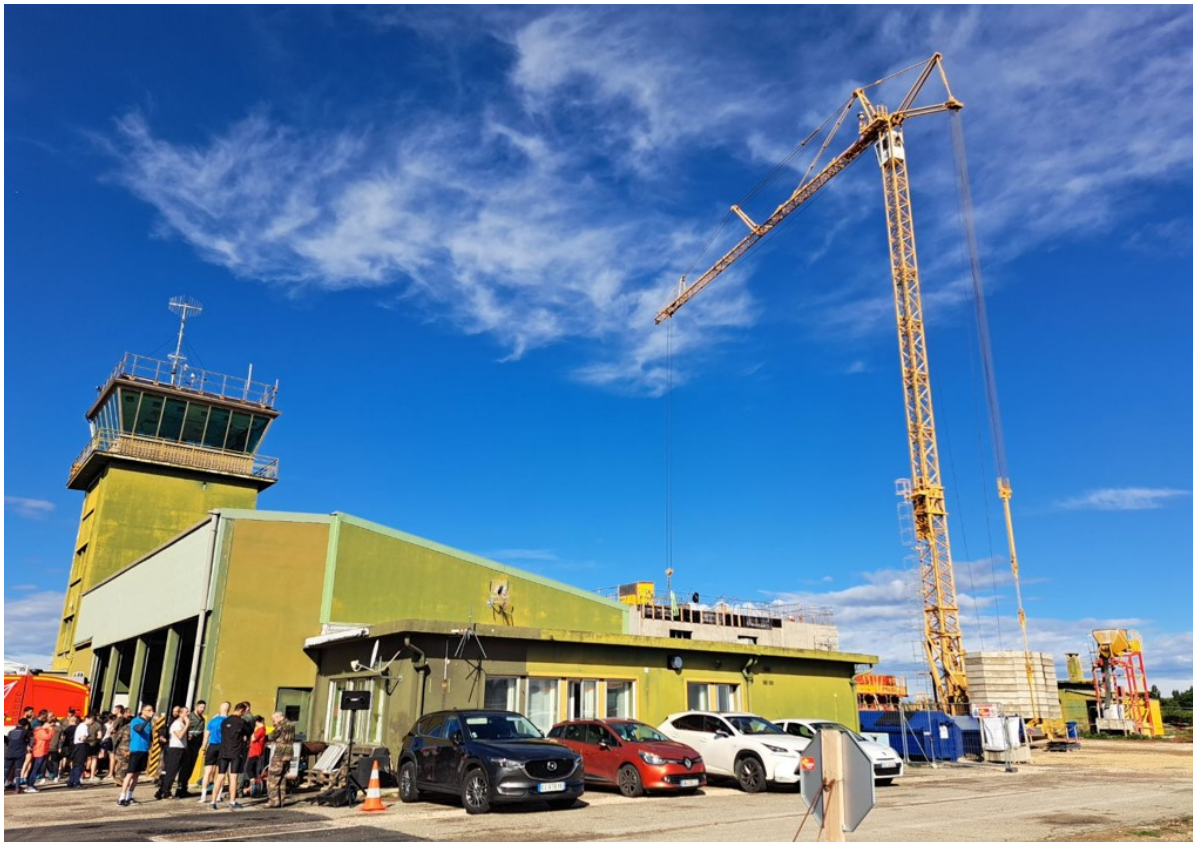
La future tour de contrôle en chantier à côté de l'ancienne.

Un sujet, parfois fait polémique dans le secteur, le bruit, les décibels provoqués lors des décollages et atterrissages des avions de chasse. « Il existe un Plan d'Exposition au Bruit » explique le patron de la BA 115. « Il ne fait pas de bruit, il constate, c'est un document d'urbanisme destiné à protéger les riverains. Nous sommes tous attentifs à l'environnement, nos familles vivent là aussi avec nos enfants. Mais nous avons des obligations opérationnelles. Nous devons concilier les deux ». Avant à l'époque des Mirage, 5 communes étaient concernées par les vols d'entraînement (Camaret, Courthézon, Jonquières, Orange et Sérignan-du-Comtat), maintenant Uchaux en plus, on passe de 2149 hectares à 3286 mais l'impact sera surtout ressenti dans des zones agricoles plutôt qu'urbanisées.