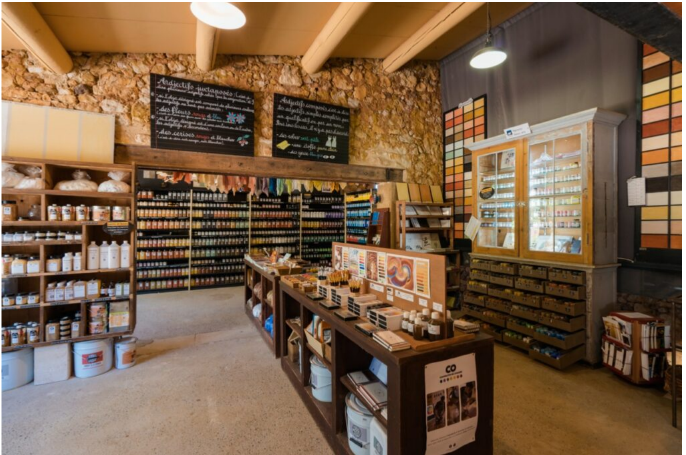
Le comptoir de pigments