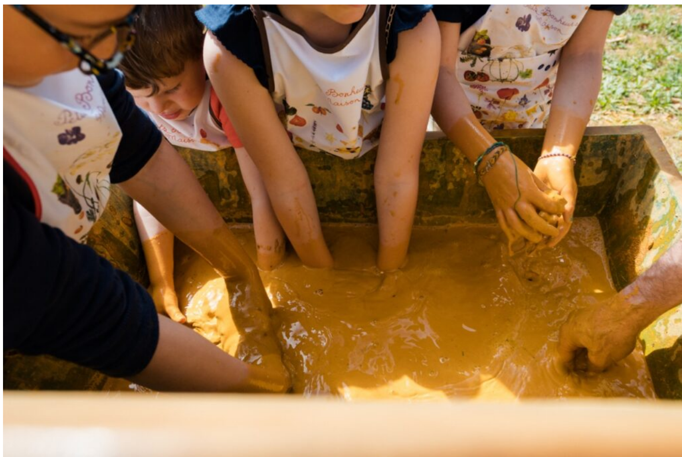
Atelier de lavage d'ocre