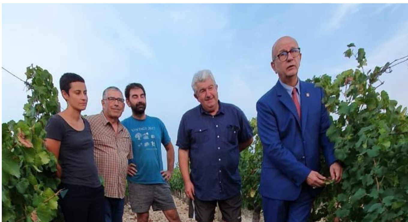
Rencontre avec les agriculteurs à Sarrians

Las, les agriculteurs du Haut Vaucluse, comme ils l'avaient craint, observent une perte très importante de production de leurs récoltes allant de 50 à 96% selon la nature des végétaux. Le sénateur a donc une nouvelle fois alerté les pouvoirs publics pour demander une aide exceptionnelle, sur plusieurs années, dévolue à soutenir la viabilité des exploitations agricoles obligées de replanter leurs végétaux et immobilisées par de futurs rendements minorés par les jeunes plants. Lucien Stanzione promet de suivre l'évolution de la situation auprès des professionnels qu'il s'est engagé à revoir en janvier prochain et à porter leur voix auprès du Ministère de l'agriculture.