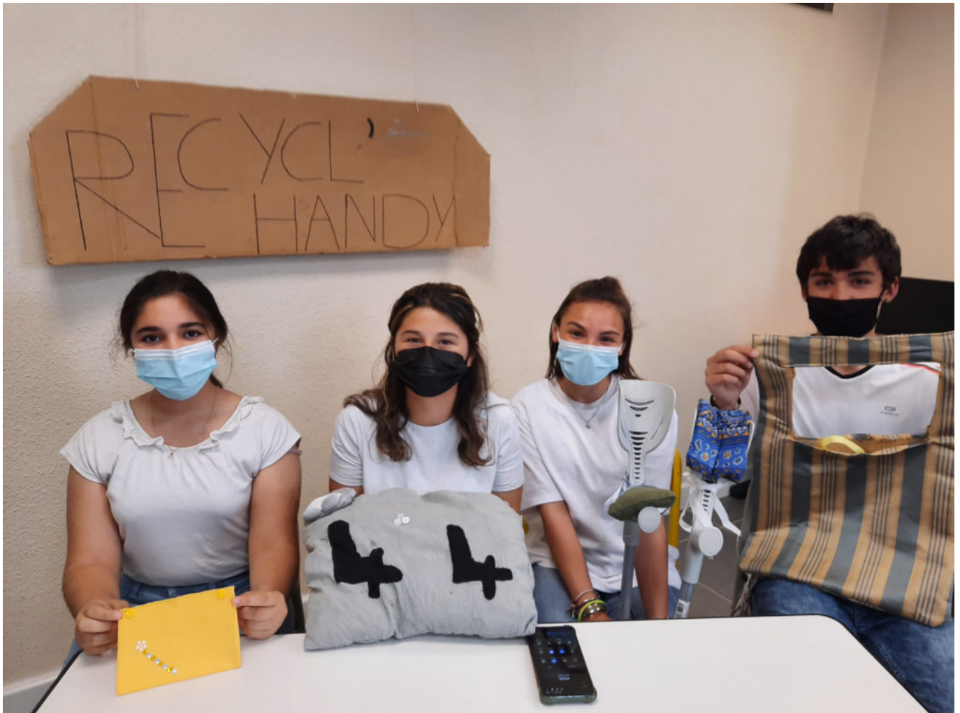
Les collégiens ont confectionné un éventail d'objets pratiques.