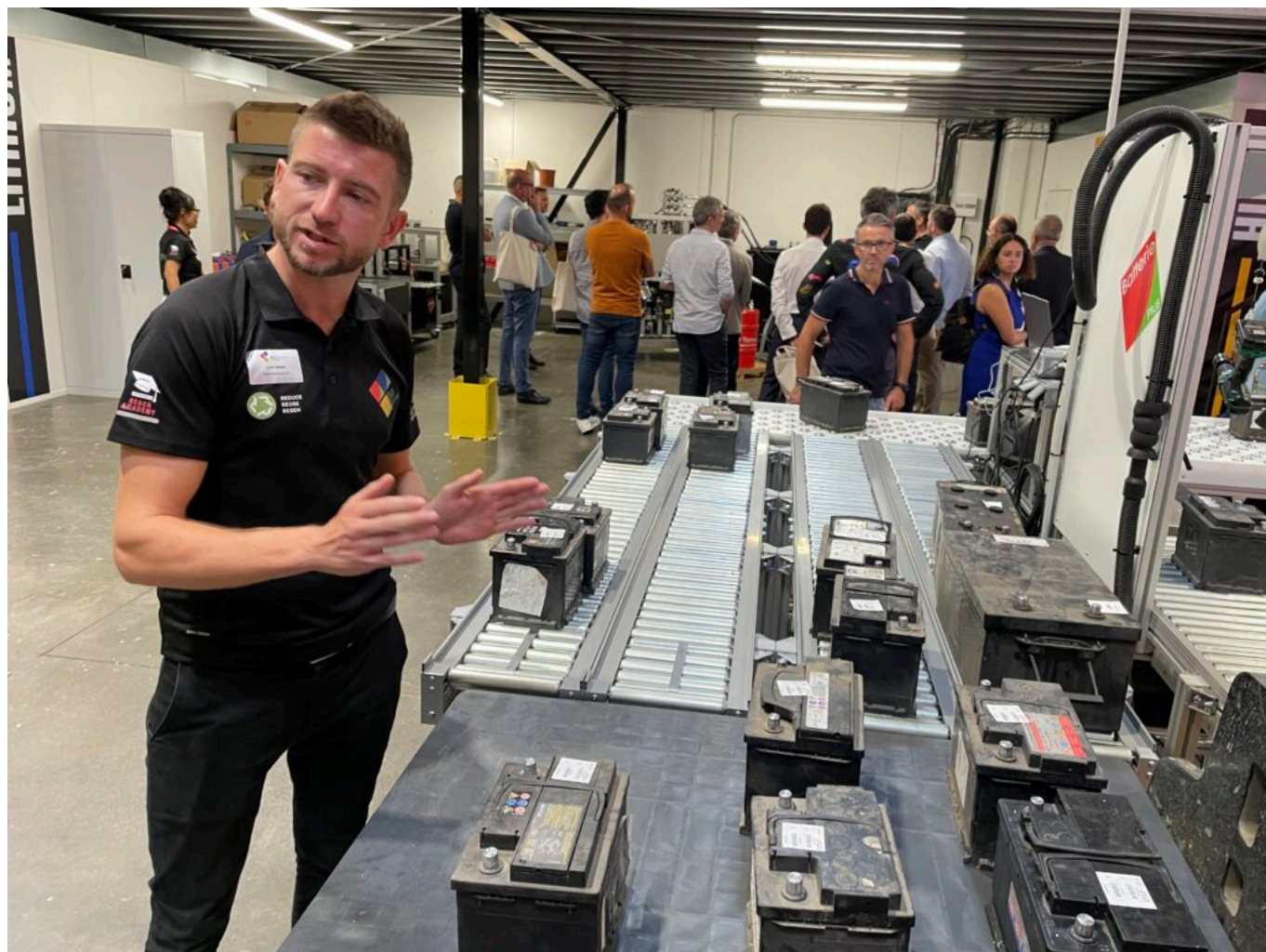
Visite de l'atelier batteries Nimh

activité à l'export. Avec tout cela vous êtes dans le Vaucluse et dans notre région Sud-Paca où nous vous soutenons depuis 2019 à hauteur de 565 000€.»