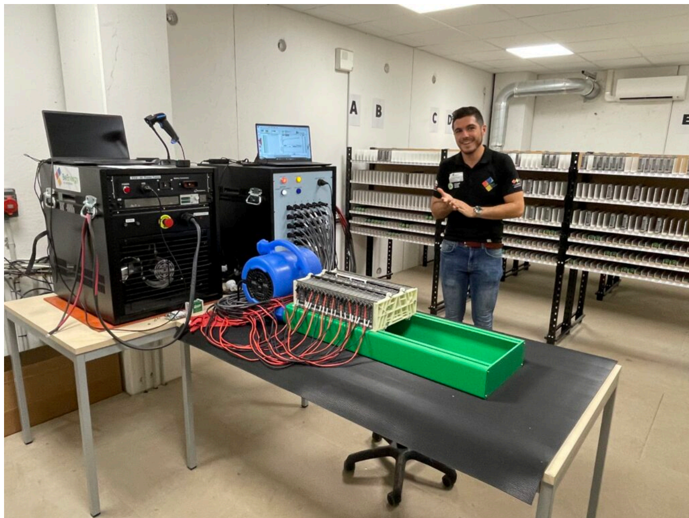
Test de batteries

se font, la plupart du temps en joint-venture -association d'entreprises et de moyens pour conquérir de nouveaux marchés- comme prochainement à l'île Maurice, en Indonésie, à la Martinique, au Bénin et en Corée du Sud, à Séoul où Be Energy Korea ouvrira sa filiale, un centre de régénération et travaillera pour le compte, excusez du peu, du métro Séoul Company.