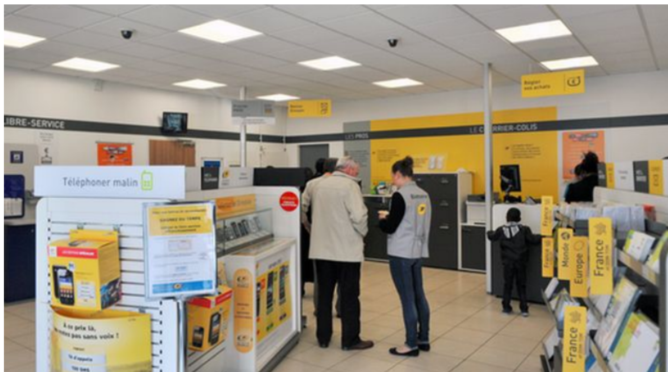
Conserver les bureaux de Poste