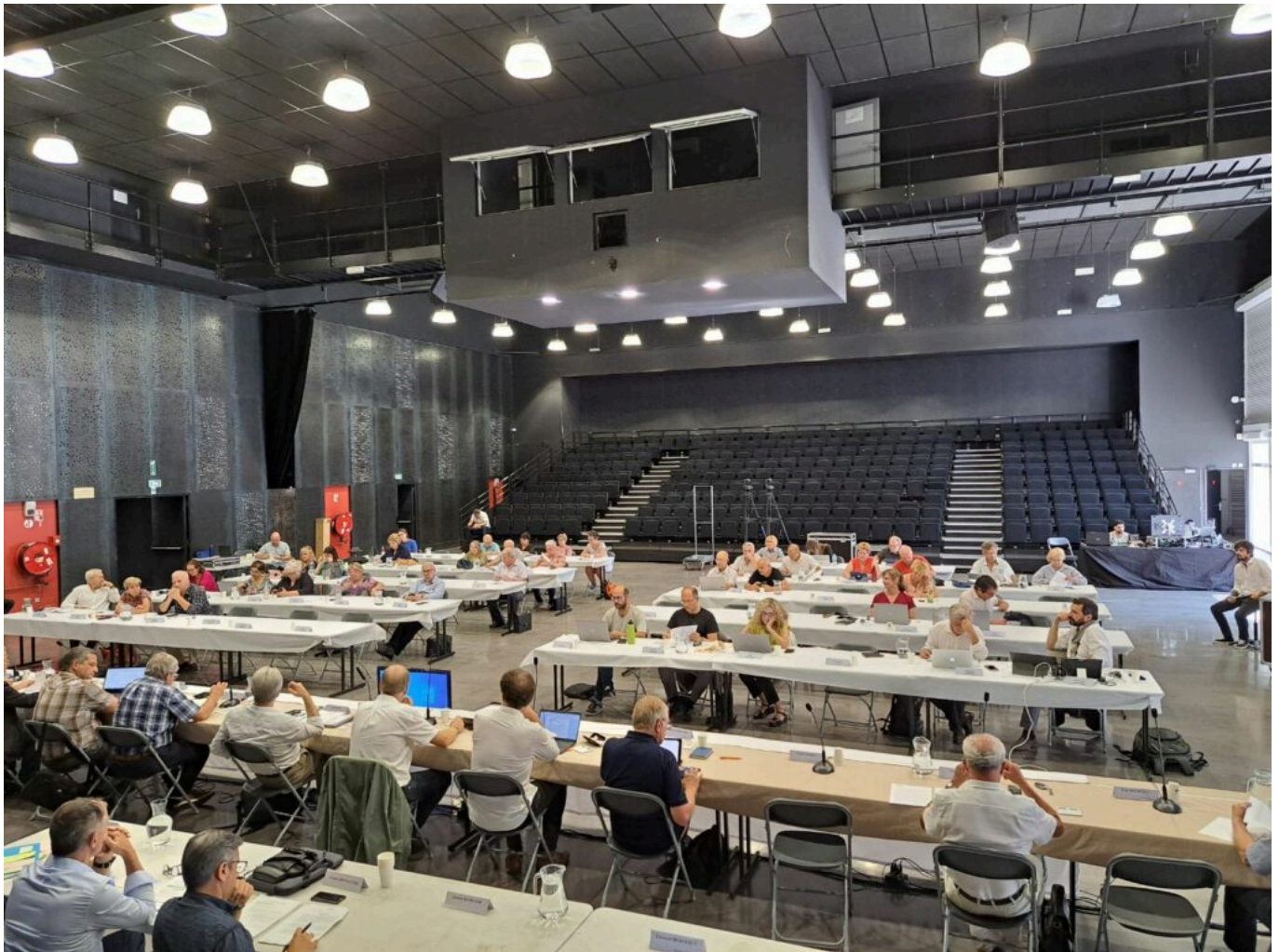
Les élus communautaires lors de la séance plénière du lundi 26 juin 2023.