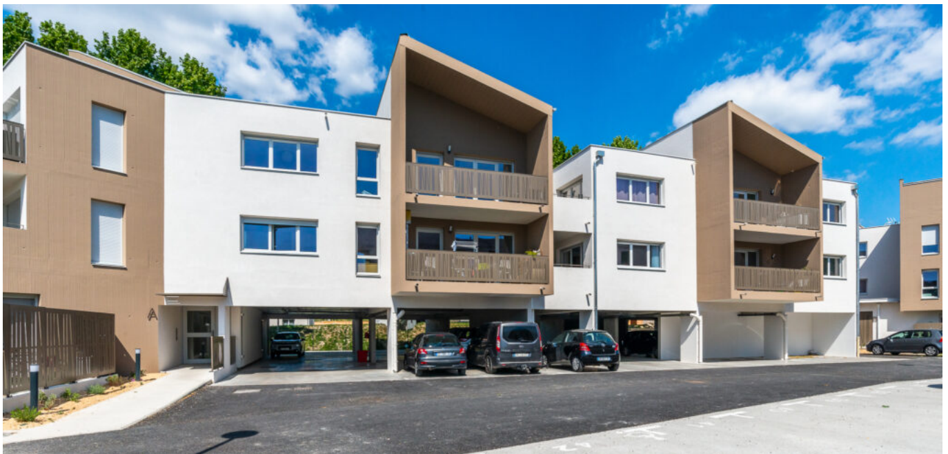
Le nouveau Chai