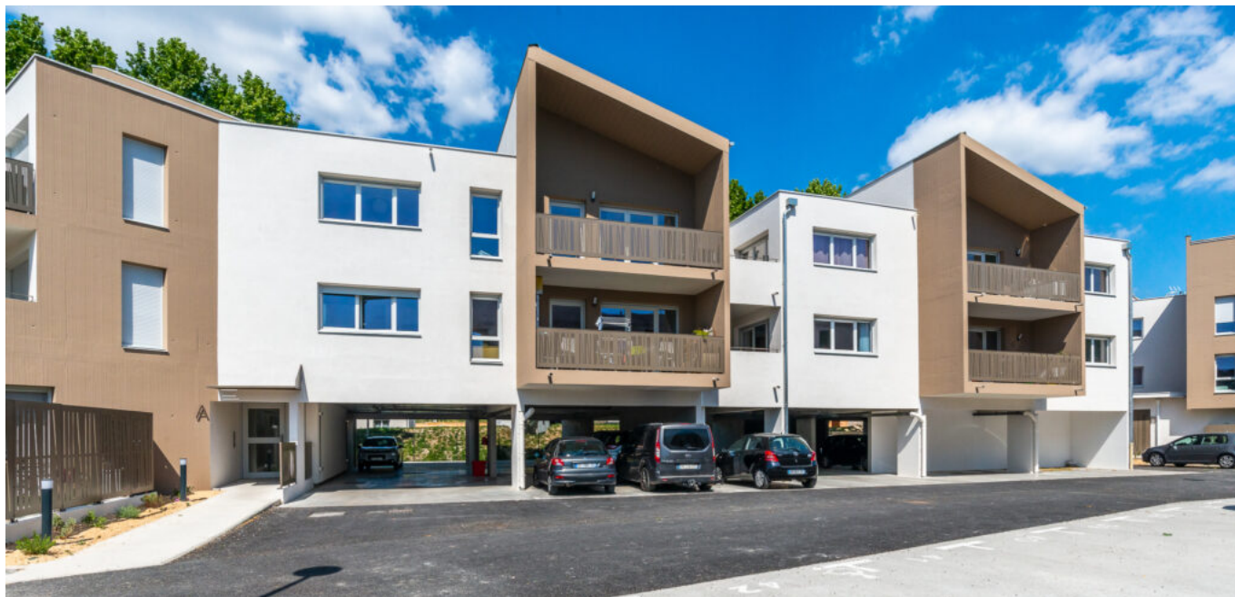
Le nouveau Chai