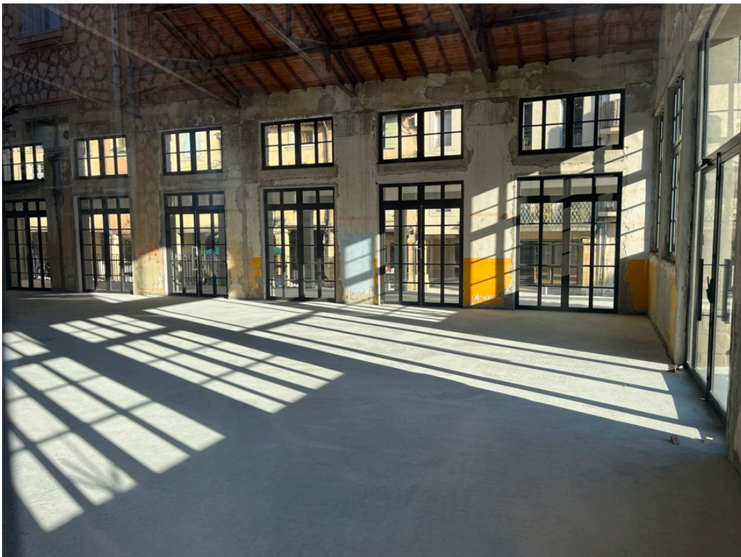
L'intérieur des halles.

Rendue aux piétons et végétalisée, la place Philippe de Cabassole a pour ambition d'être un des lieux attractifs de la ville. Confié à l'agence d'architectes Avantpropos de Cavailon, le réaménagement de cette place et la rénovation de sa halle commerçante attenante a nécessité 9 mois de travaux et 3M€ de budget. Ce projet a été porté financièrement par la Ville et l' Agglomération Luberon Monts de Vaucluse avec l'appui de subventions de l'État et de la région Sud à hauteur de 765 000 €.