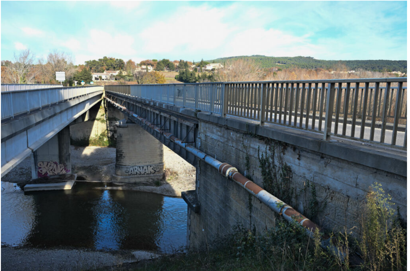
Le pont Valentin (à gauche) et le pont qui va être destiné à la véloroute (à droite).