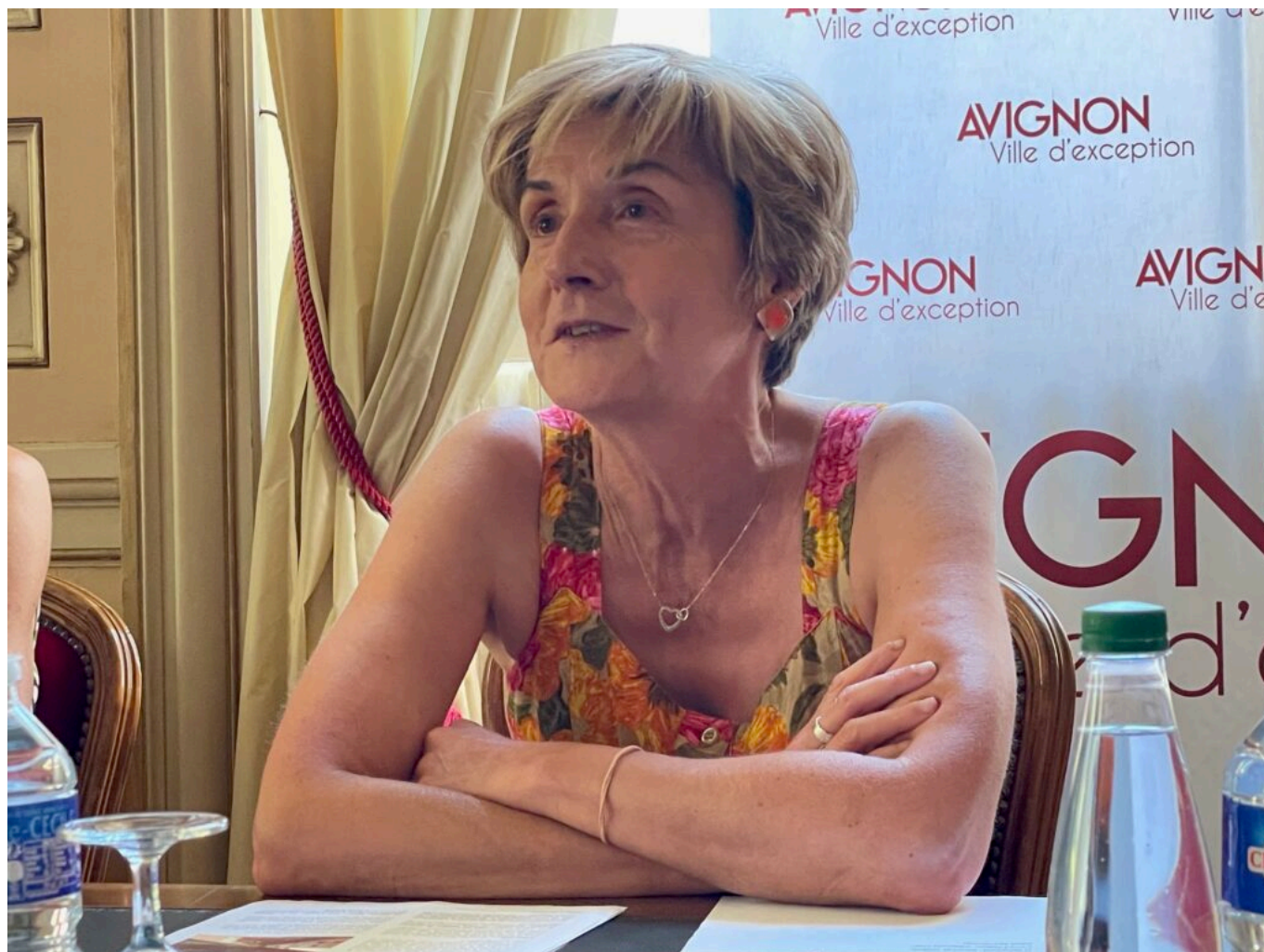
Cécile Helle, maire d'Avignon

'A l'image des requalifications urbaines, menées depuis 2014, de la nouvelle vie de la Cour des Doms -dont le quartier des femmes est actuellement en travaux et abritera notamment la friche artistique-, demain celle des Bains Pommer, des grands chantiers de rénovation d'équipements publics, comme le stade nautique ou actuellement la bibliothèque Renault-Barrault, la Ville s'engage sur des préservations et la mise en valeur du patrimoine, tout en participant à l'attractivité de la ville et à la qualité de vie de ses habitants. Le Groupe è-Hôtels acquiert l'Hôtel des Monnaies et l'Hôtel Niel pour la somme de 2,3M€ pour une surface plancher totale de 1 770m 2 .'