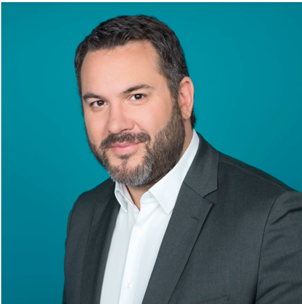
Bruce Toussaint, journaliste et présentateur chez BFM TV