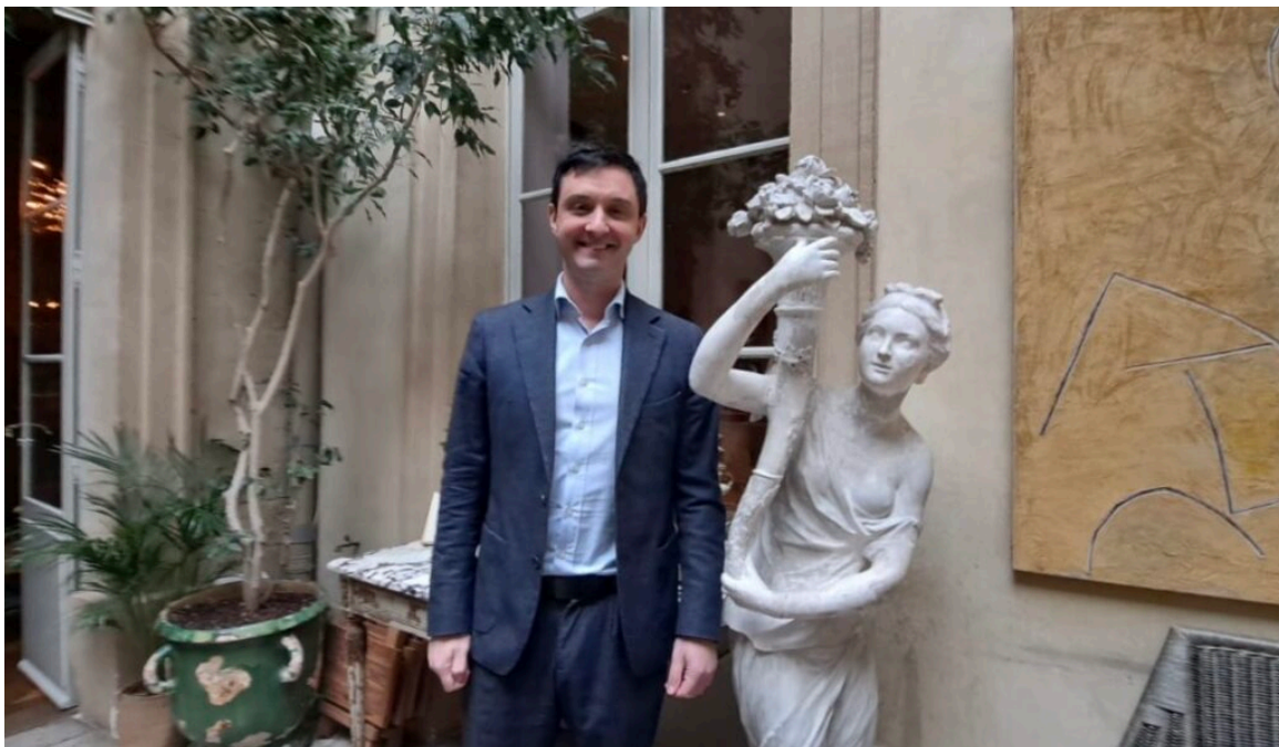
Richard Kitaeff, maire de Gordes.

L'an dernier, malgré une météo mitigée, plus de 15 000 lecteurs avaient grimpé à Gordes. Vu le programme dense et éclectique, ils seront sans doute encore plus nombreux cette année.