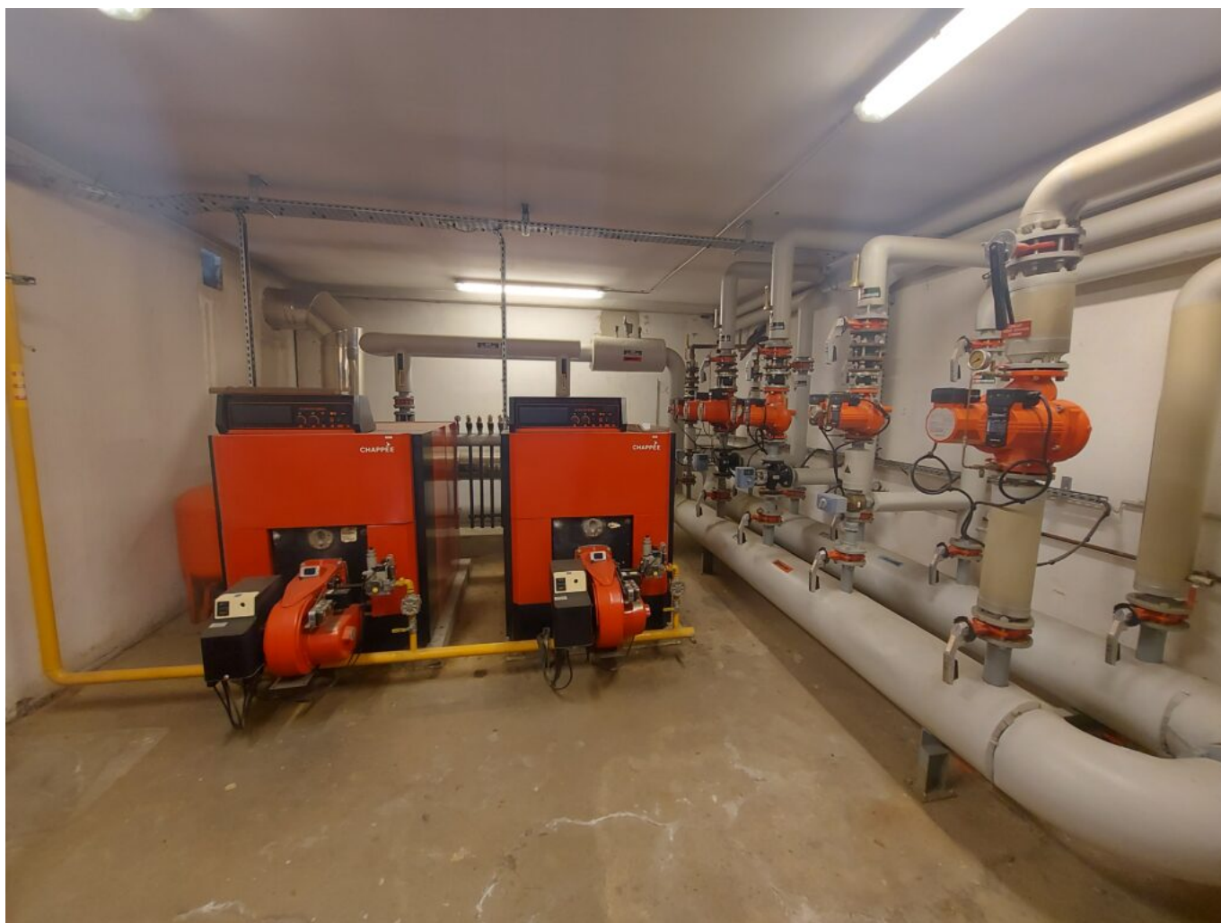
Chaufferie collège A Silve

Ce programme s'inscrit dans un nouveau marché public d'exploitation des équipements thermiques des bâtiments départementaux mis en œuvre jusqu'en 2032 et couvre 72 bâtiments identifiés et imposera aux prestataires des objectifs de performance énergétique mesurables.